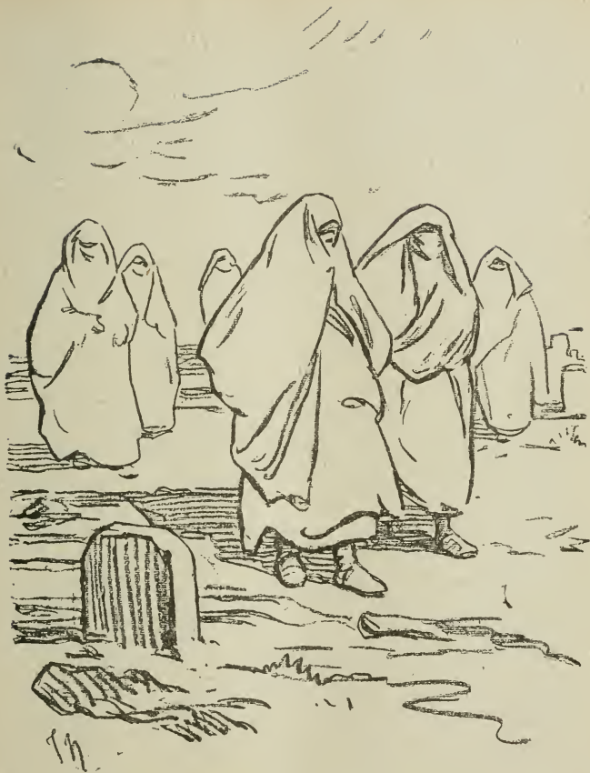
FEMMES SE RENDANT AU CIMETIÈRE