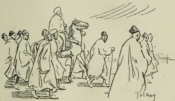
LE PACHA DE FEZ

niales retentissantes, du calme Moghreb, — par dessus le fracas sauvage de la guerre d'Europe !