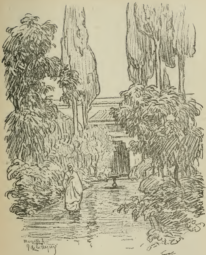
JARDIN DE LA BAHIA A MARRAKECH