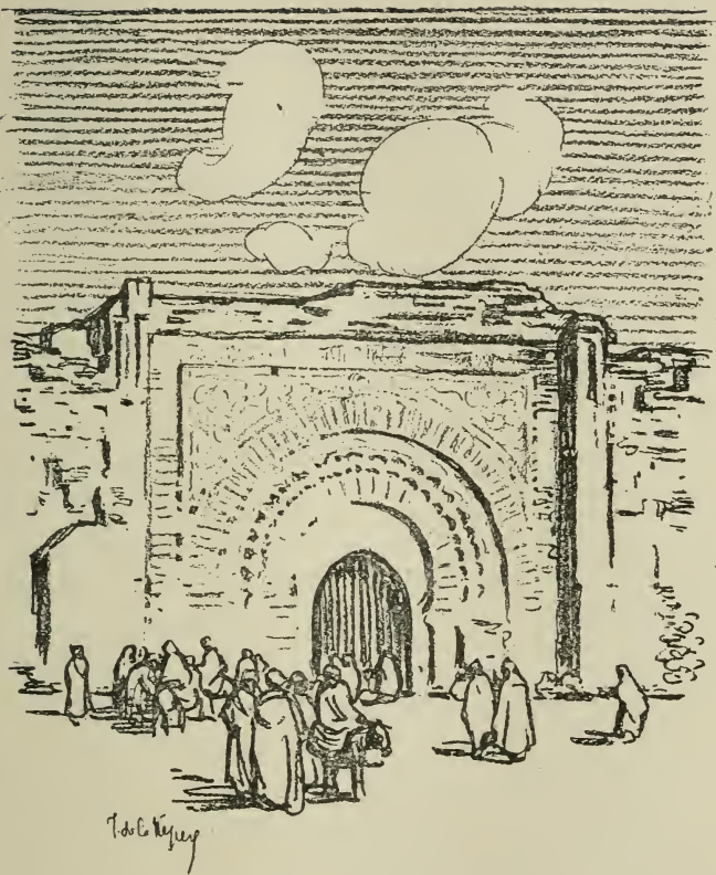
UNE PORTE A MARRAKECH