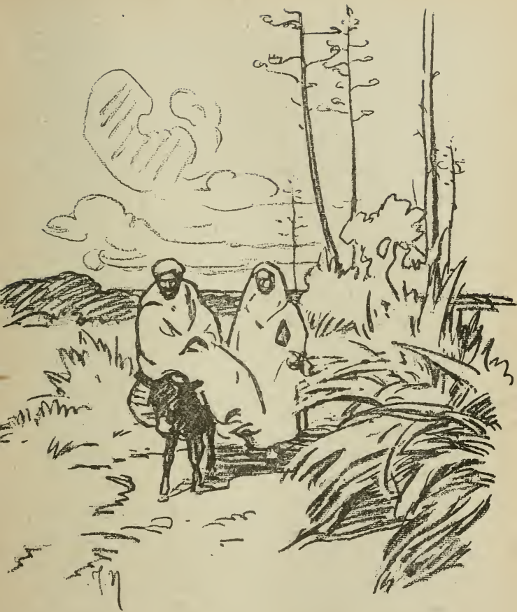
CHEMIN CREUX AUX ENVIRONS DE RABAT