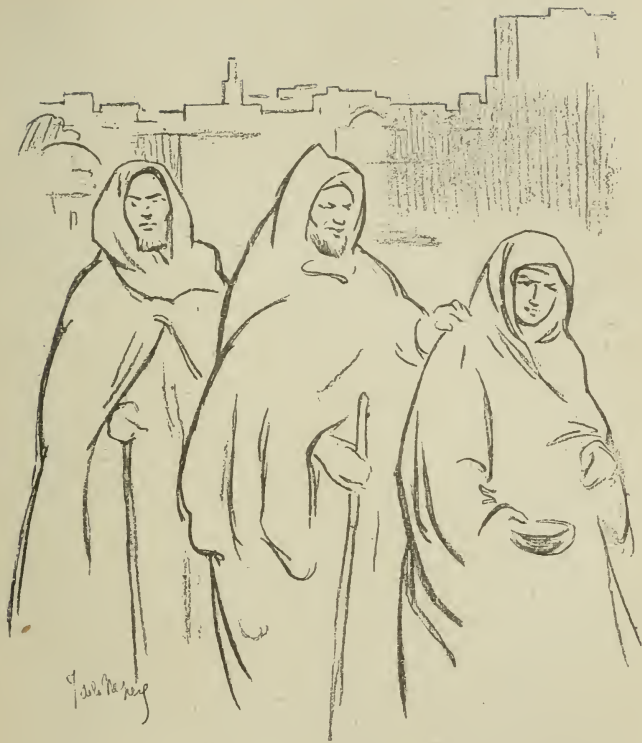
AVEUGLES A RABAT