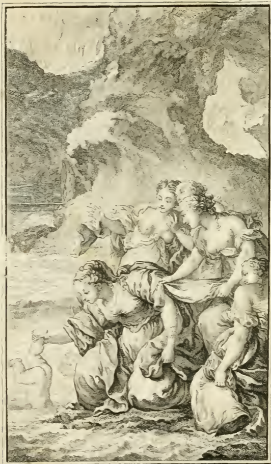
Thetis, liv. I.