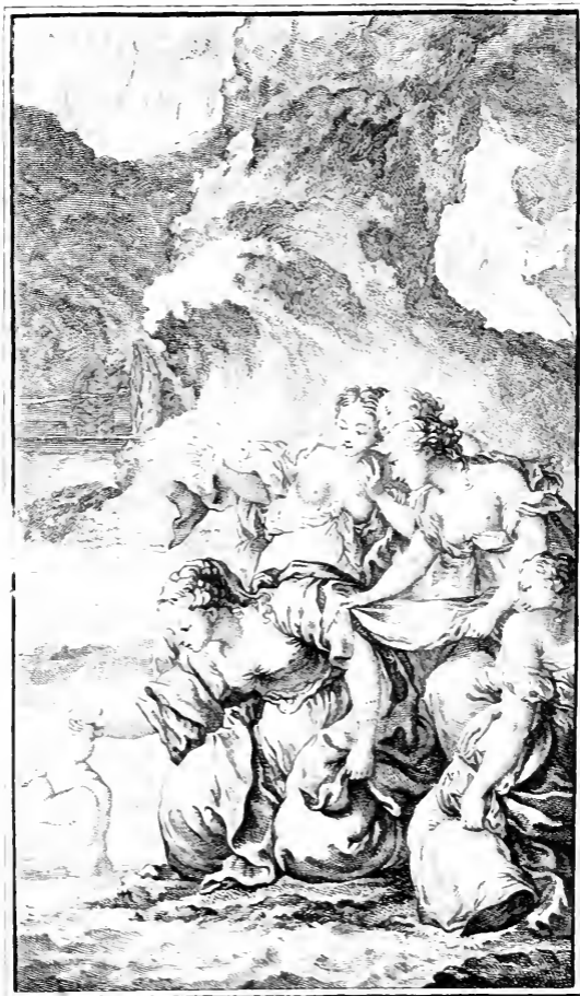
Thetis, liv. I.