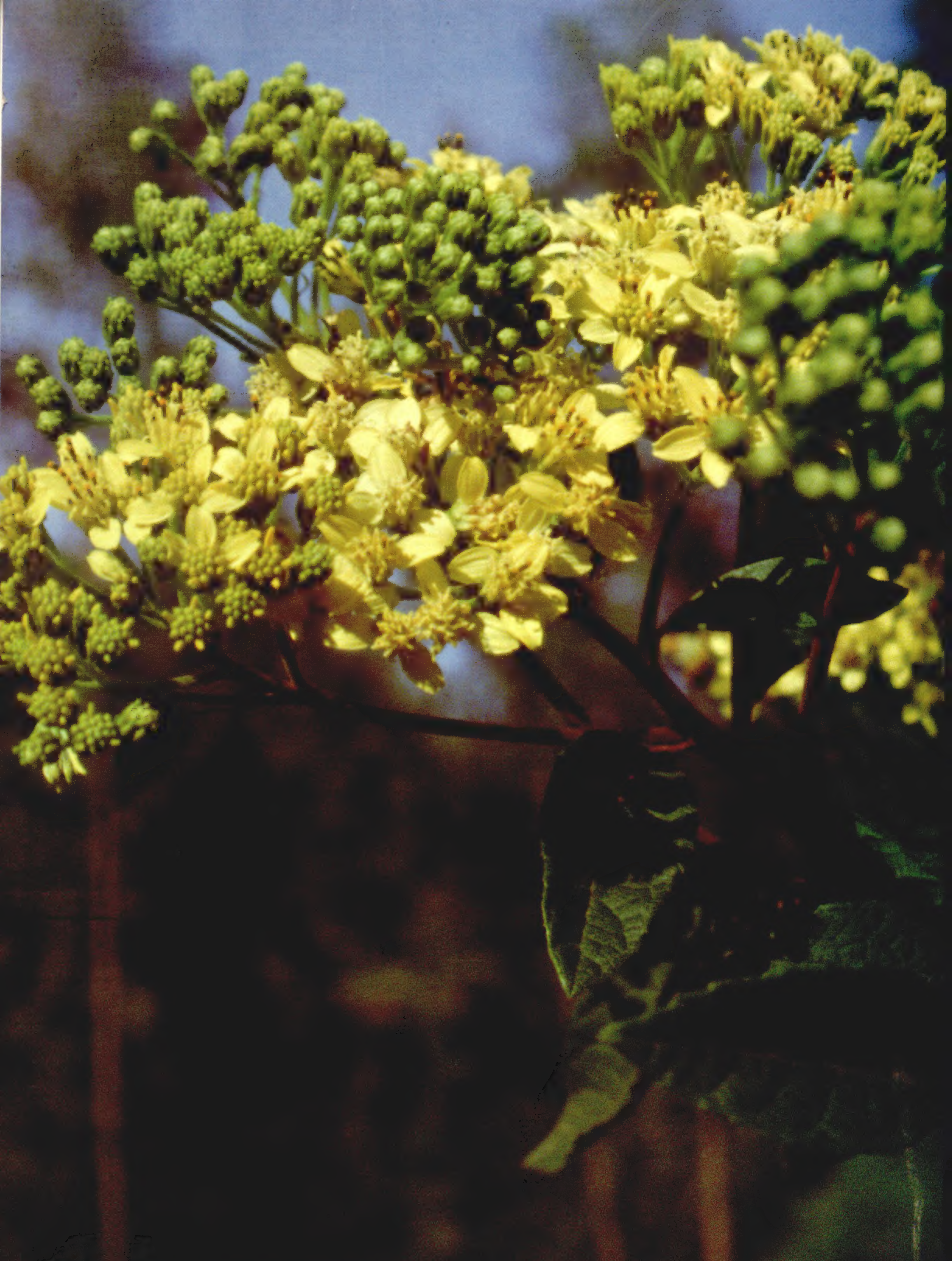
Verbesina contumacensis Sagástegui