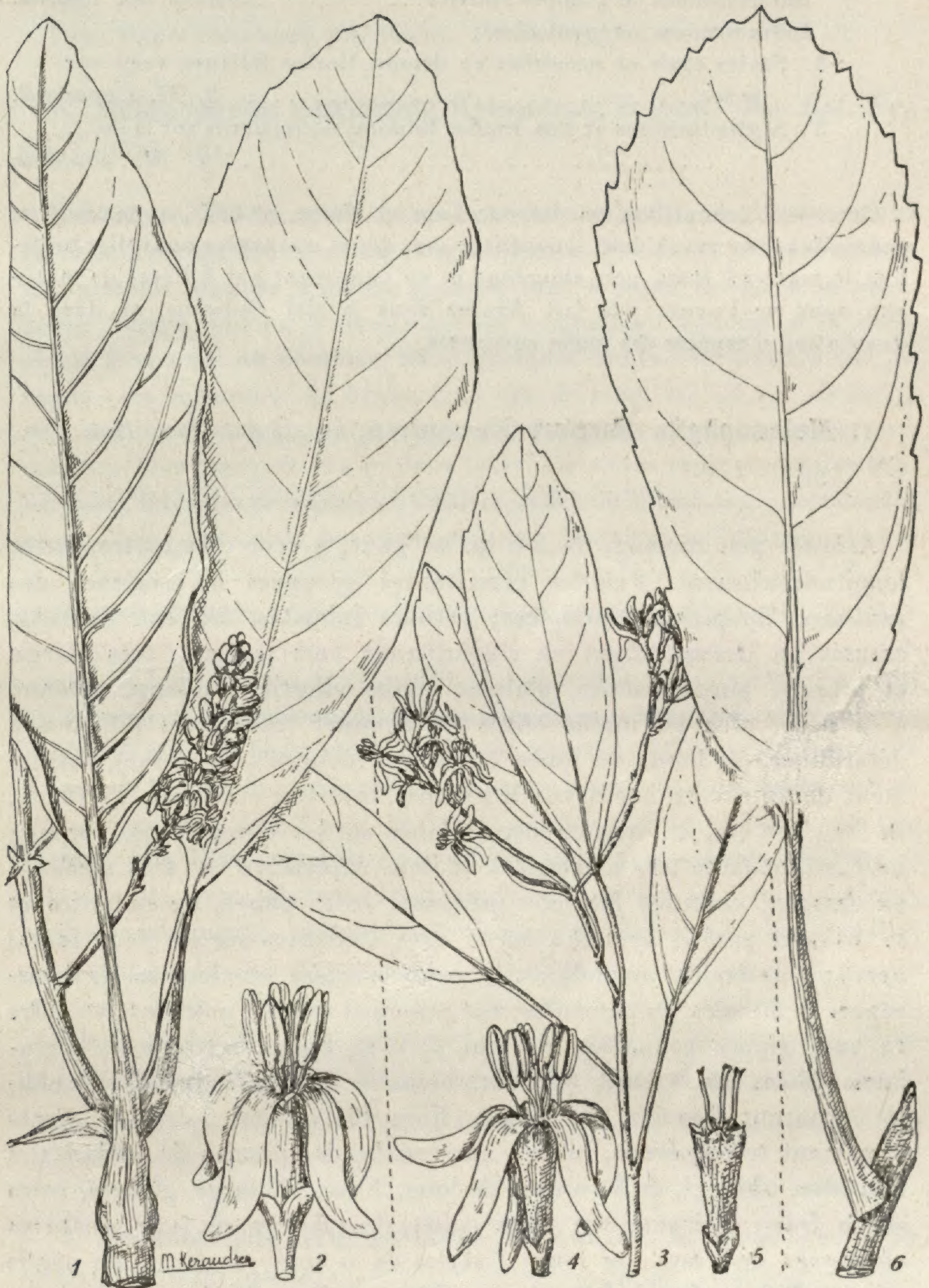
FIG. I. — Melanophylla Perrieri : 1, feuilles et fragment d'inflorescence \times 2/3 ; 2, fleur \times 3 . — M. longipetala : 3, rameau florifère \times 2/3 ; 4, fleur \times 3 ; 5, calice et styles \times 3 . — M. aucubaefolia : feuille \times 2/3 .