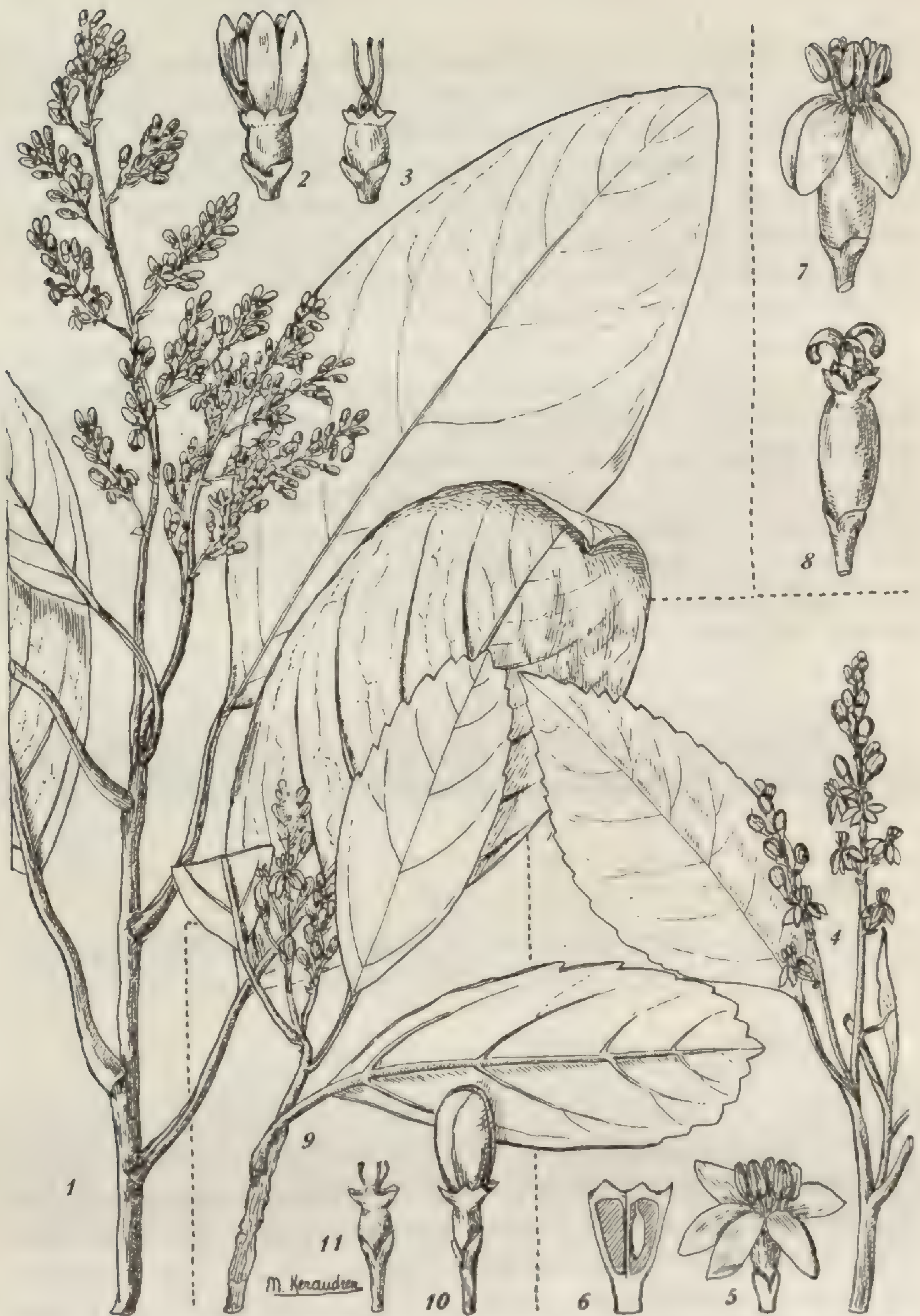
FIG. III. — Melanophylla Humbloti : 1, rameau florifère \times 2/3 ; 2, fleur en bouton \times 3 ; 3, calice et styles \times 3 ; — M. crenata : 4, rameau florifère \times 2/3 ; 5, fleur épanouie \times 3 ; 6, coupe longitudinale schématique du capelle \times 4 . — M. Capuronii : 7, fleur \times 3 ; 8, calice et styles \times 3 . — M. alnifolia : 9, rameau florifère \times 2/3 ; 10, bouton floral \times 3 ; 11, calice et styles \times 3 .