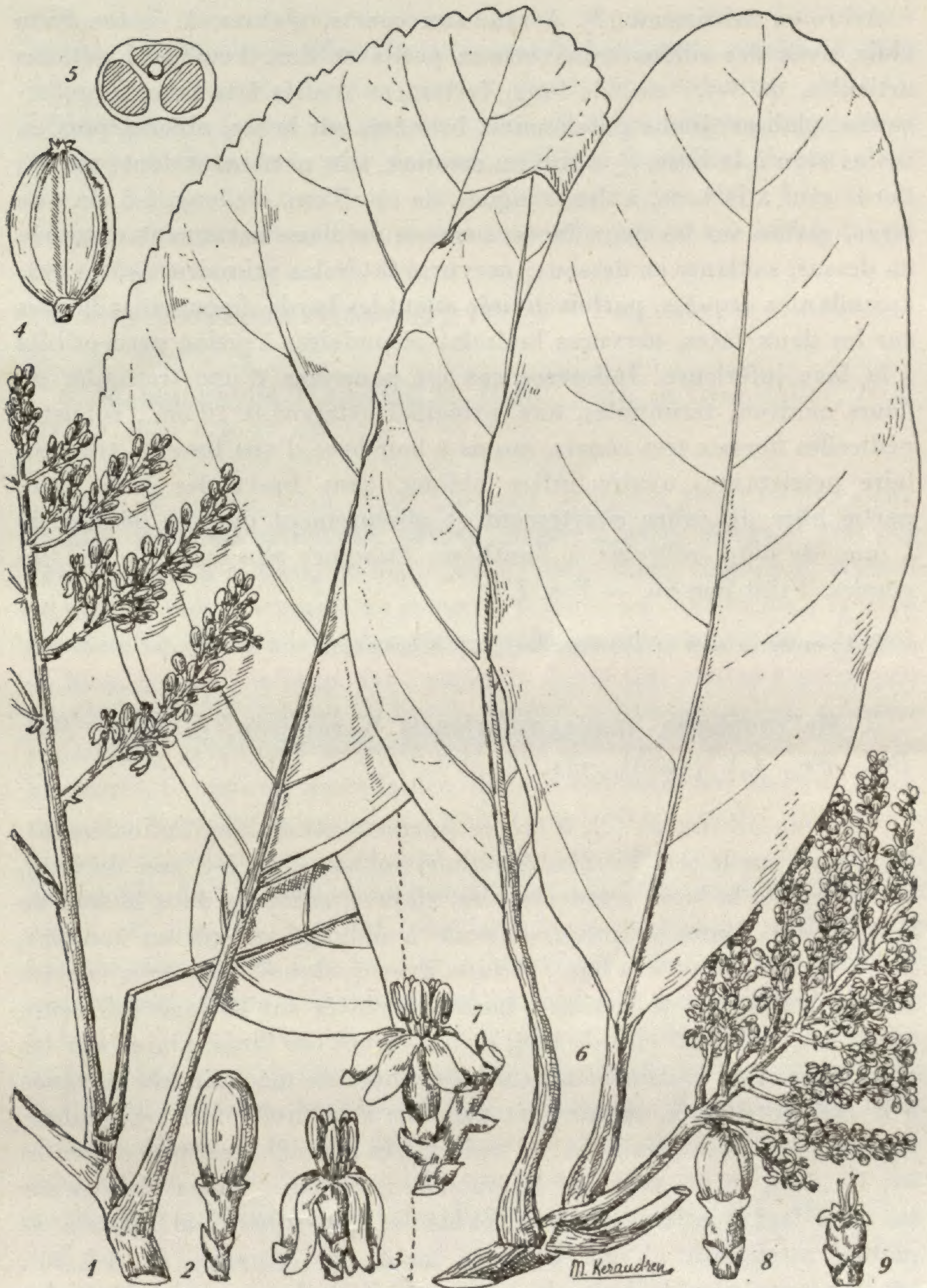
FIG. II. — Melanophylla Humbertiana : 1, feuille et fragment d'inflorescence \times 2/3 ; 2, Bouton floral \times 3 ; 3, fleur épanouie \times 3 ; 4, fruit \times 2 ; 5, coupe transversale schématique du fruit \times 2 . — M. madagascariensis : 6, rameau florifère \times 2/3 ; 7, bouton floral \times 3 ; 8, fleur épanouie \times 3 ; 9, calice et styles \times 3 .