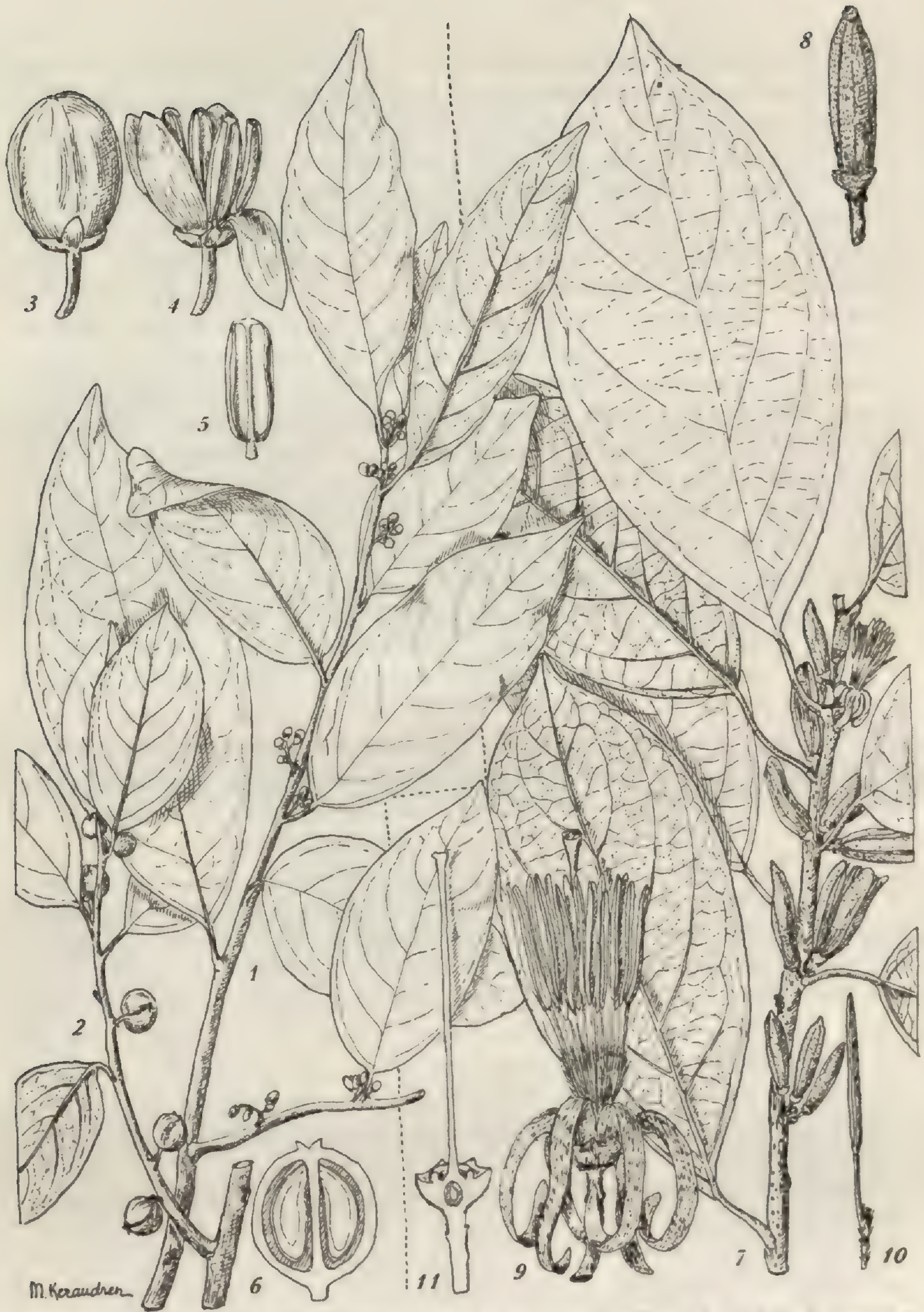
FIG. IV. — Kaliphora madagascariensis : 1, rameau florifère ♂ × 2/3; 2, rameau fructifère ♀ × 2/3; 3, bouton floral ♂ × 6; 4, fleur ♂ × 6; 5, étamine × 6; 6, coupe d'une drupe × 3. — Alangium salviifolium ssp. decapetalum : 7, rameau florifère × 2/3; 8, bouton floral G. N.; 9, fleur épanouie × 2; 10, étamine × 2; 11, coupe longitudinale du calice, ovaire et style × 2.