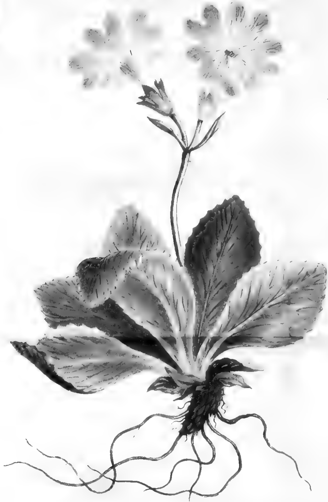
Primula integrifolia variet.