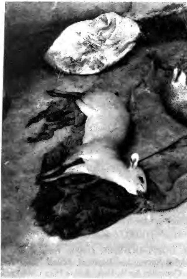
Red-flanked duiker on display for sale at Toumodi bushmeat market. Céphalophes à flancs roux exposé pour vente au marché de viande de brousse à Toumodi.