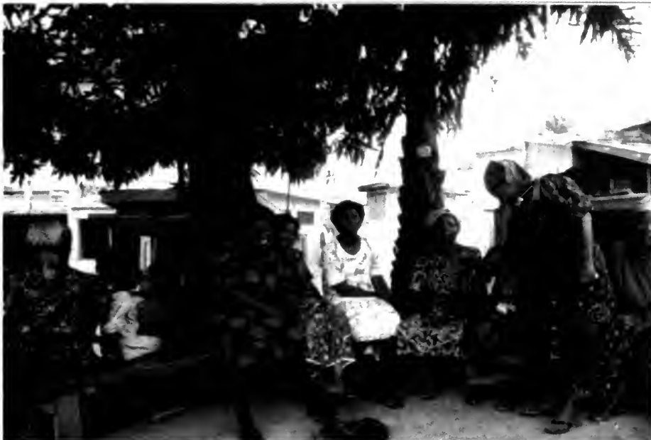
Wholesale women vendors of bushmeat at the Atwemonom market at Kumasi in Ghana. Vendeuses à vente en gros de viande de brousse au marché de Atwemonom à Koumassi en Ghana.