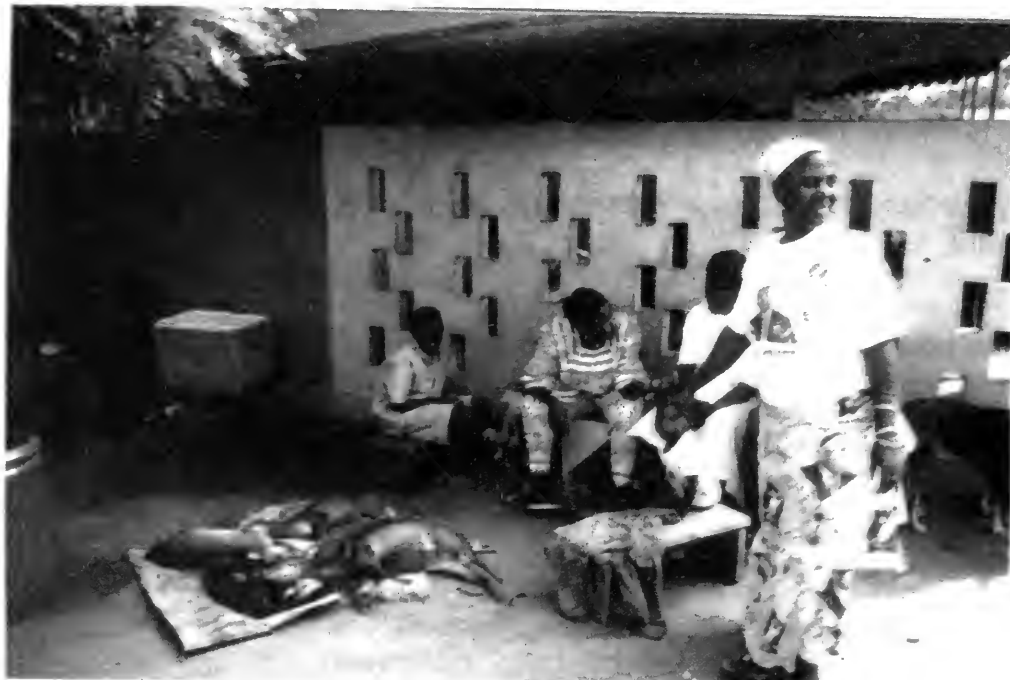
Market women at the Toumodi bushmeat market. Vendeuses de viande de brousse au marché de Toumodi.