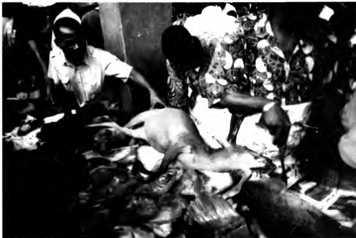
Bushmeat stall at a market in Pointe Noire, Congo (Brazzaville). Etal de viande de brousse à Pointe Noire, en Congo (Brazzaville).