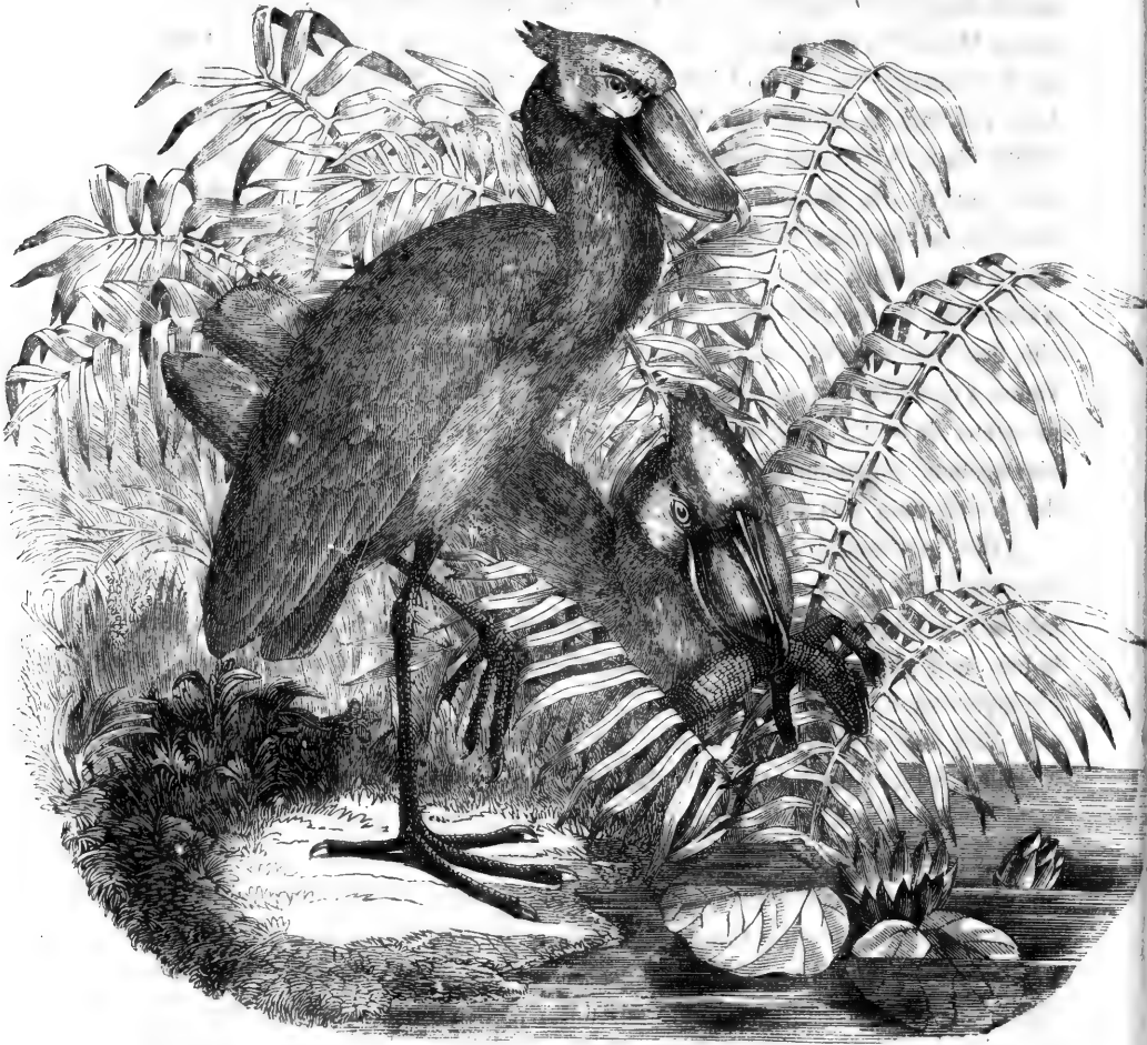
Balaeniceps rex , Gould,

Ankauf nicht, nachdem ich in Kordofan rein ausgeplündert worden war. Zwar etwas verstimmt, sprach ich doch gegen meinen Sekretär die frohe Hoffnung aus, dass wir ohne Zweifel bald diese Vögel in England erscheinen sehen würden. Wirklich ist meine Vorhersagung eingetroffen. Vor kurzer Zeit hat der berühmte englische Ornithologe Gould dieses Genus unter dem Namen Balaeniceps bekannt gemacht.