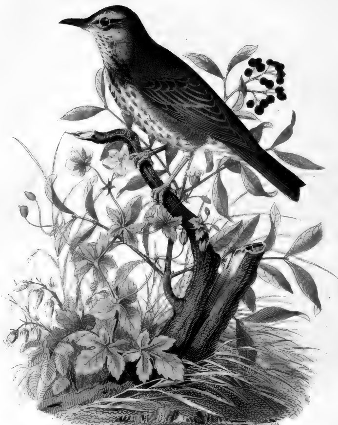
H. Allen et. del. pinx. 32.