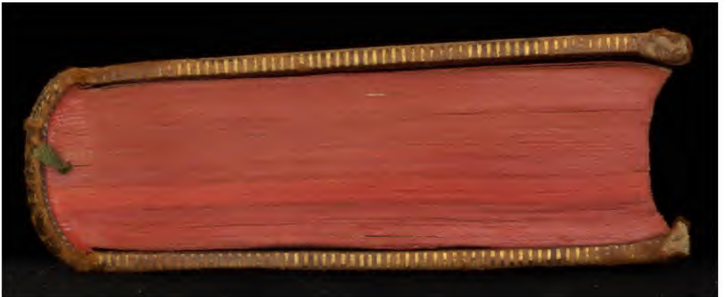
Early European Books, Copyright © 2011 ProQuest LLC. Images reproduced by courtesy of Koninklijke Bibliotheek, Den Haag. 346 G 41 [1]