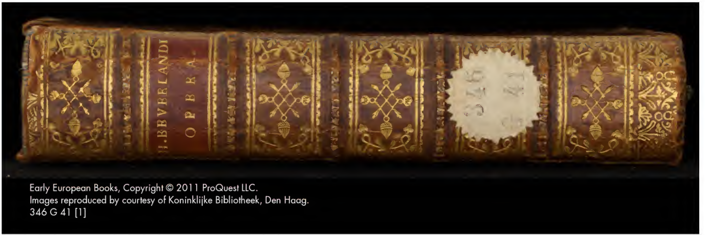
Early European Books, Copyright © 2011 ProQuest LLC. Images reproduced by courtesy of Koninklijke Bibliotheek, Den Haag. 346 G 41 [1]