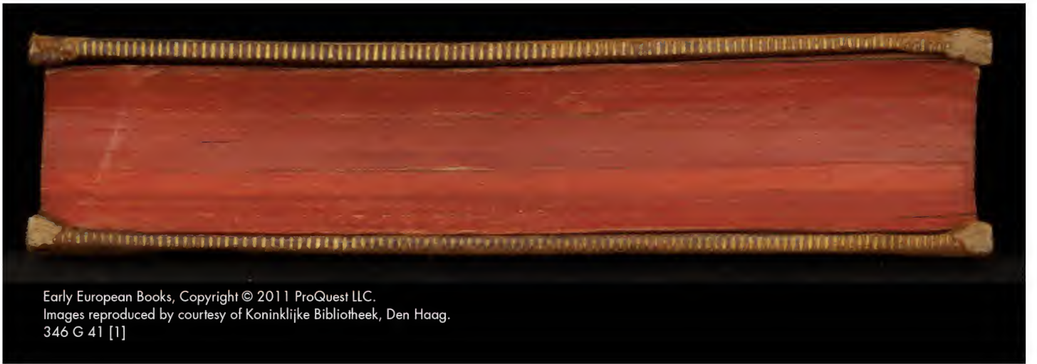
Early European Books, Copyright © 2011 ProQuest LLC. Images reproduced by courtesy of Koninklijke Bibliotheek, Den Haag. 346 G 41 [1]