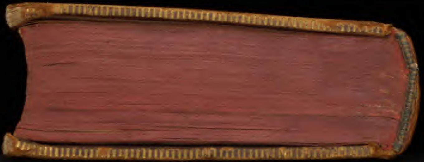
Early European Books, Copyright © 2011 ProQuest LLC. Images reproduced by courtesy of Koninklijke Bibliotheek, Den Haag. 346 G 41 [1]