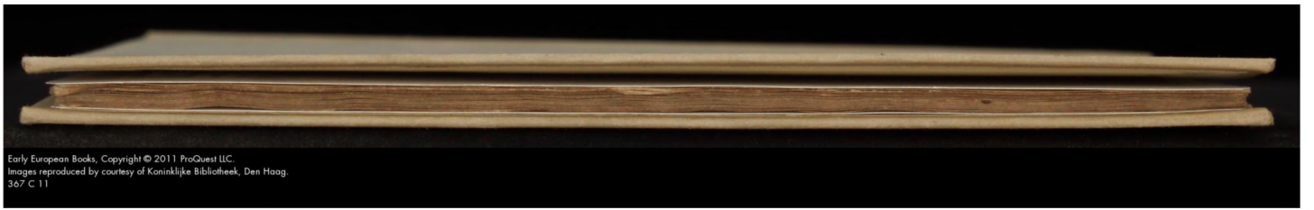
Early European Books, Copyright © 2011 ProQuest LLC. Images reproduced by courtesy of Koninklijke Bibliotheek, Den Haag. 367 C 11