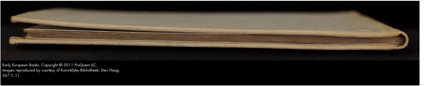
Early European Books, Copyright © 2011 ProQuest LLC. Images reproduced by courtesy of Koninklijke Bibliotheek, Den Haag. 367 C 11