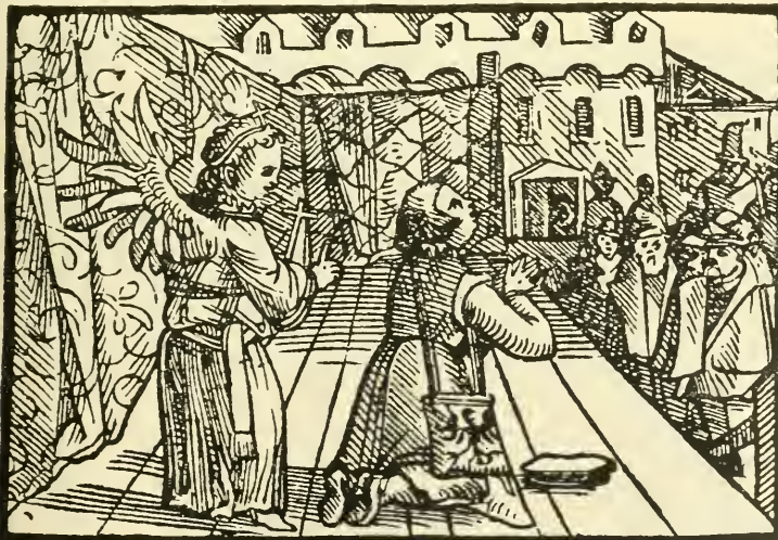
Fig. 4. Allhie schieden sie abe, vnd die Eltern giengen wieder zu Hauss, darnach fiel Hänslein auff die Knie, huob die Hand auff vnd sahe mit den Augen gehn Himmel vnd sprach:

Der zweite Aufführungstag beschäftigt sich wieder mit den weiteren Schicksalen des Übeltäters Aleator und seines Kumpans, des 'Jud Ulman'. In einer