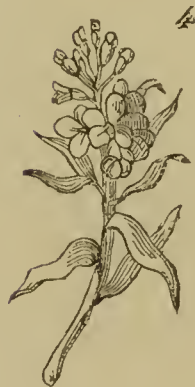
1. GERANIO, pag. 75. 3. OLIVO, pag. 128.