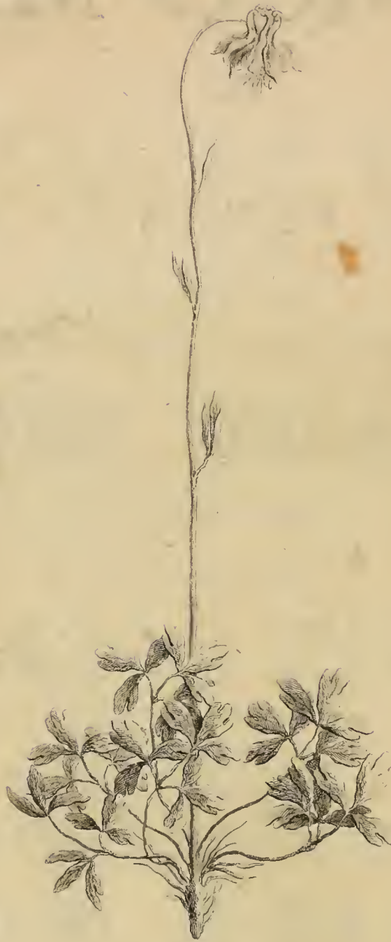
AQUILEGIA montana parvo flore Thalictri folio C. B.