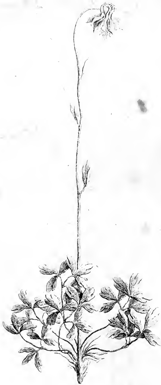
AQUILEGIA montana parvo flore Thalictri folio C. B.