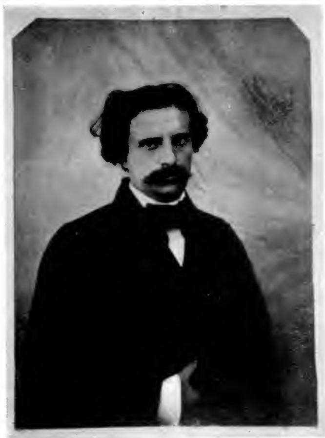
PORTRAIT DE FRANÇOIS-VICTOR. — 1855. — MAISON DE VICTOR HUGO.