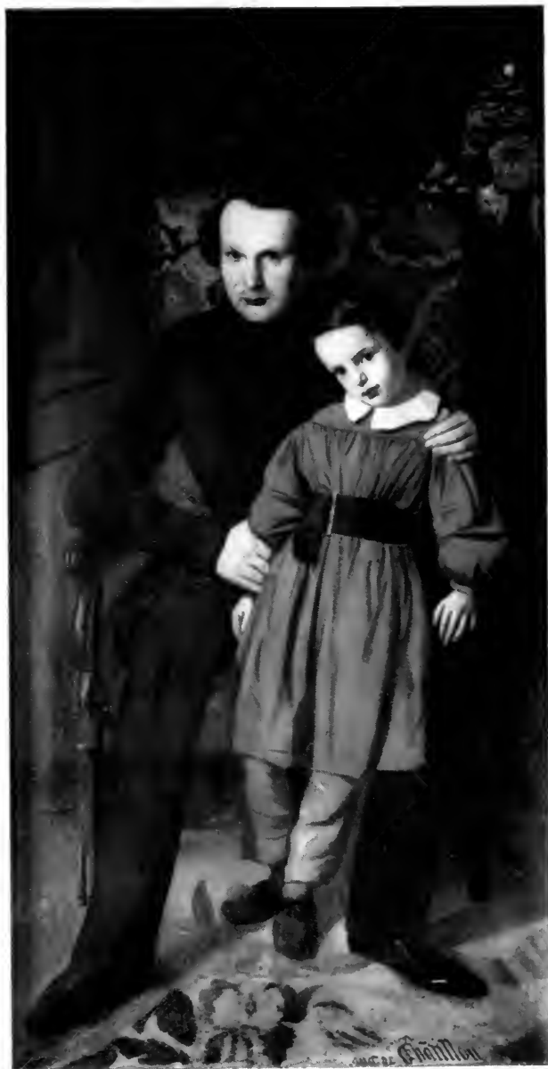
VICTOR HUGO ET SON FILS FRANÇOIS-VICTOR. PEINTURE PAR AUGUSTE DE CHÂTILLON. — 1836. — MAISON DE VICTOR HUGO.