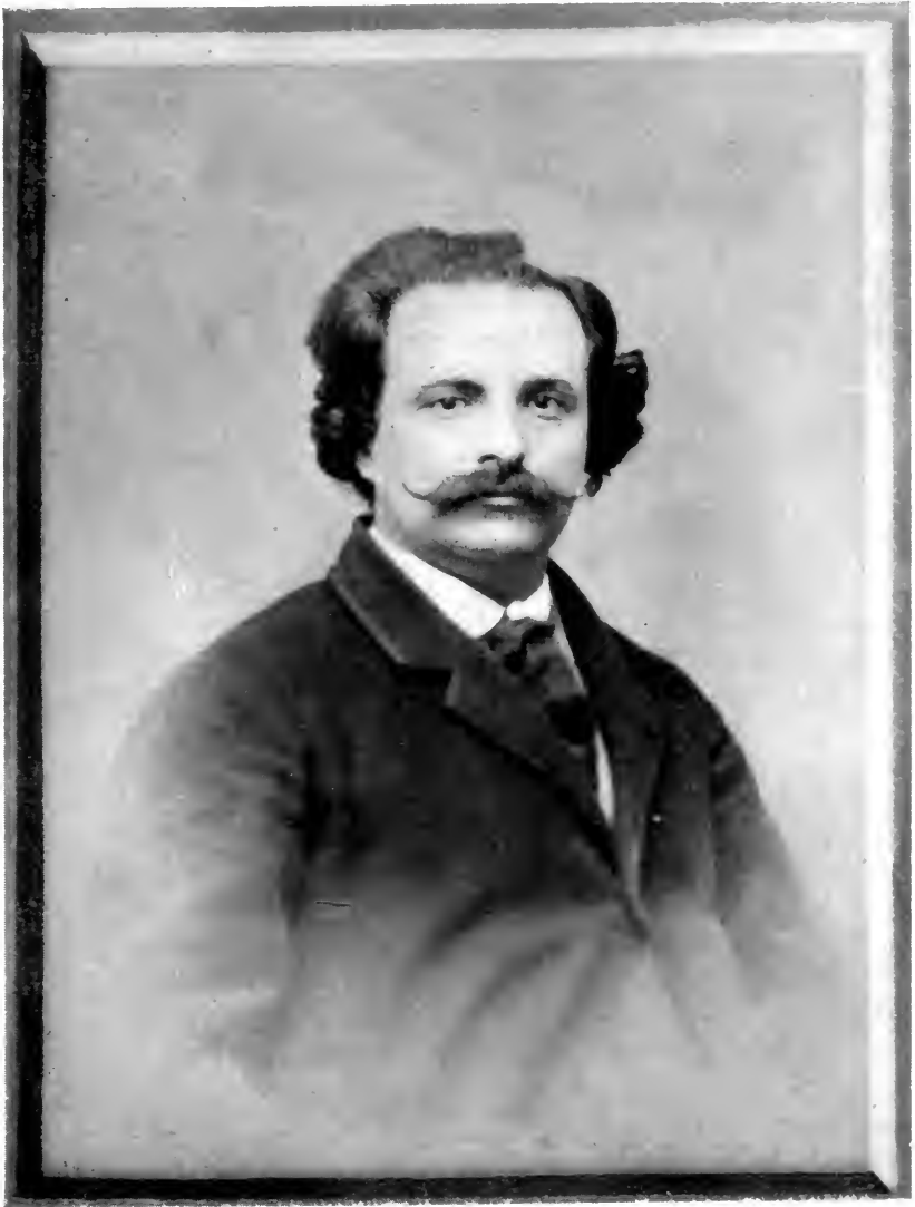
PORTRAIT DE CHARLES HUGO. — MAISON DE VICTOR HUGO.