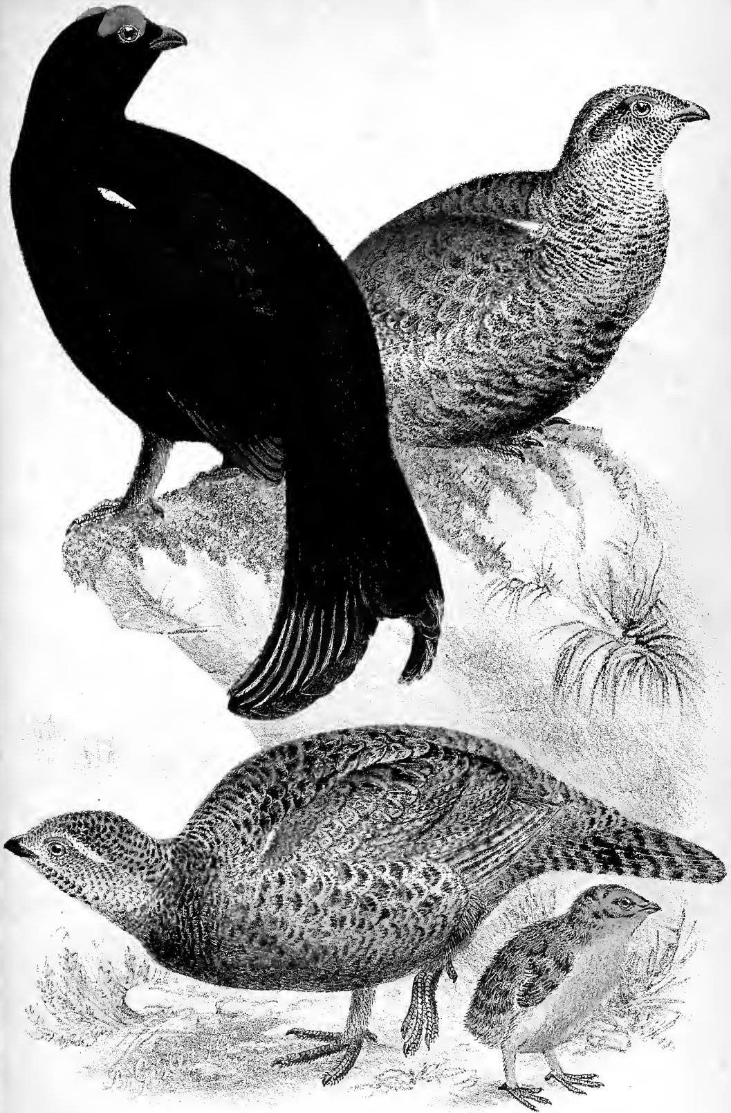
Kaukasisches Birkhuhn ( Tetrao mlokosiewiczi Tacz.)