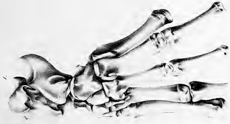
Phoca vitulina 1/2