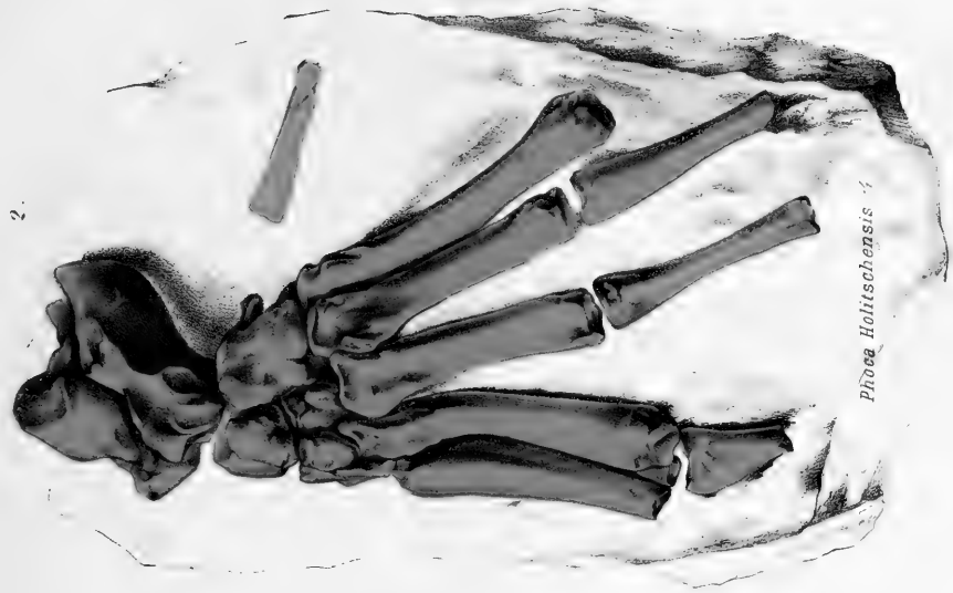
Phoca Holitschensis 1/2