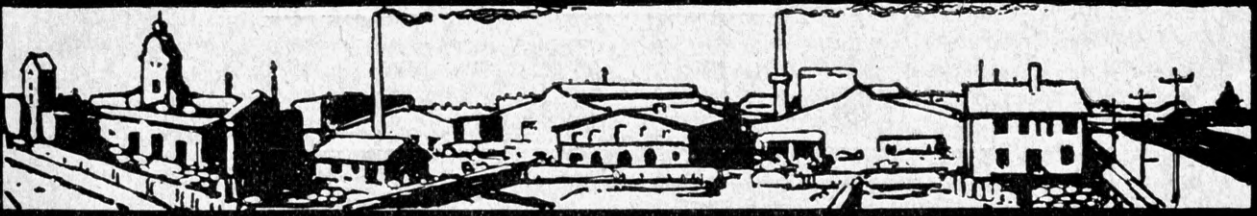
WERK IN DESSAU

Dr. Heinr. König u. Co. G.m.b.H. Chemische Fabrik - Leipzig-Plagwitz