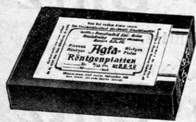
Durch die Photohändler

130 Textseiten ausgezeichnete Bilder Ladenpreis 50 Pfg. Seite 56: