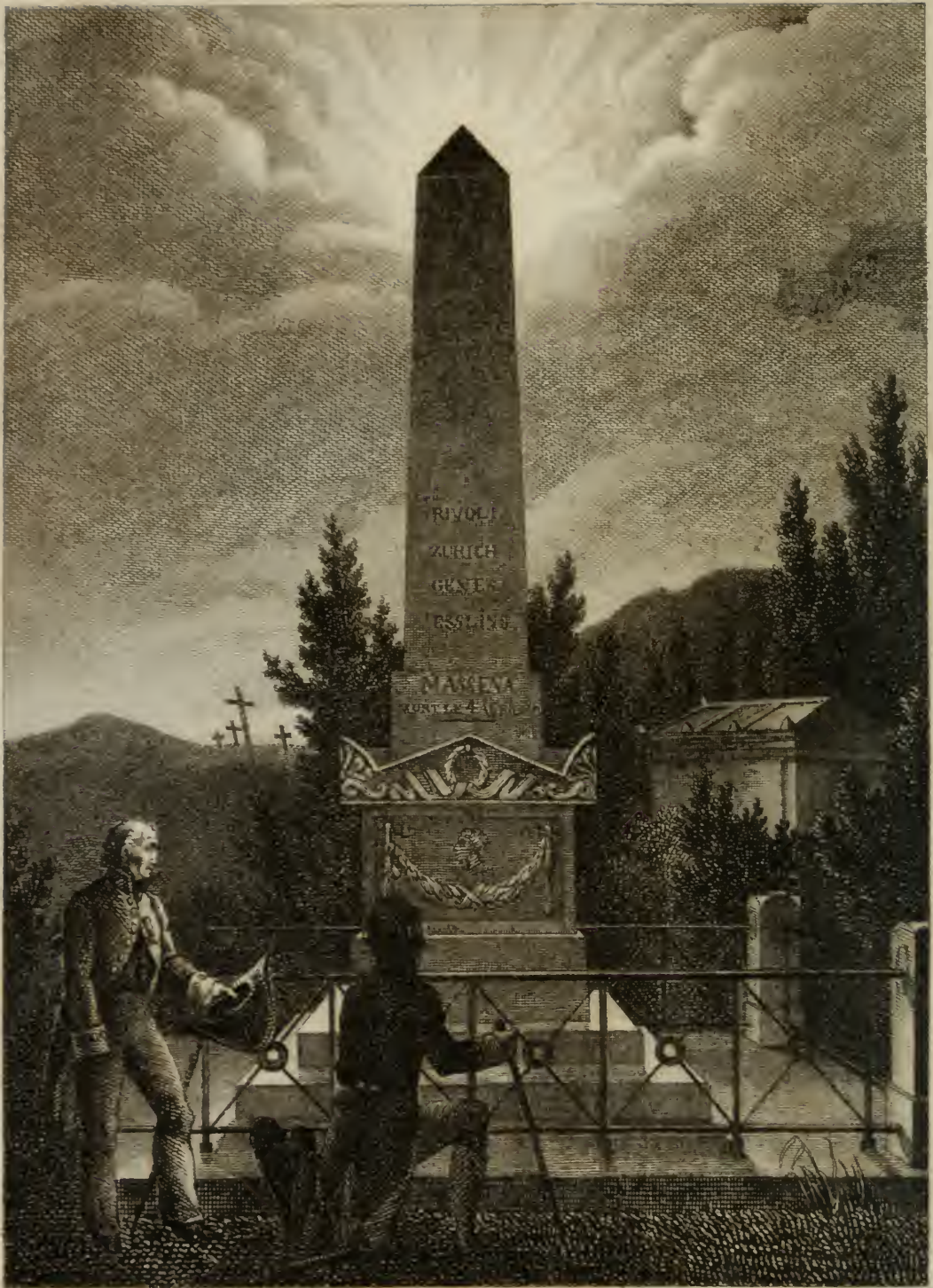
TOMBEAU DE MASSÉNA.