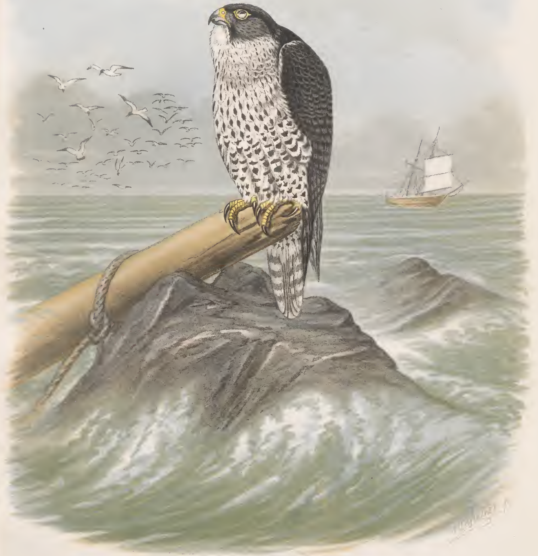
FALCO GYRFALCO, SCHLEG. Norwegischer Jagdfalke. Ältes Männchen.