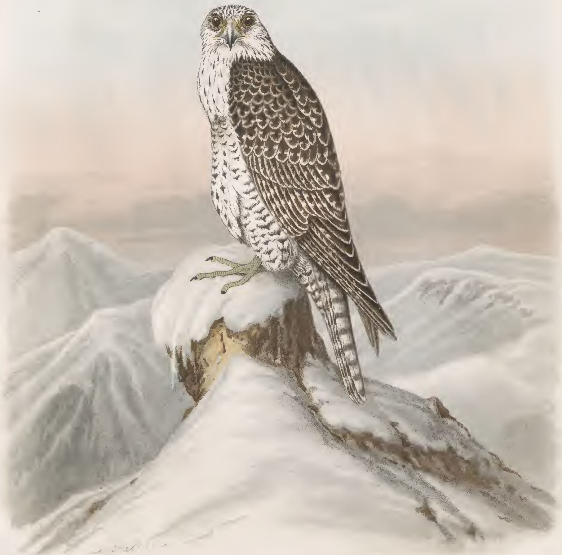
FALCO ARCTICUS, HOLBÖLL. Grönlandischer Jagdfalke. Weibchen.