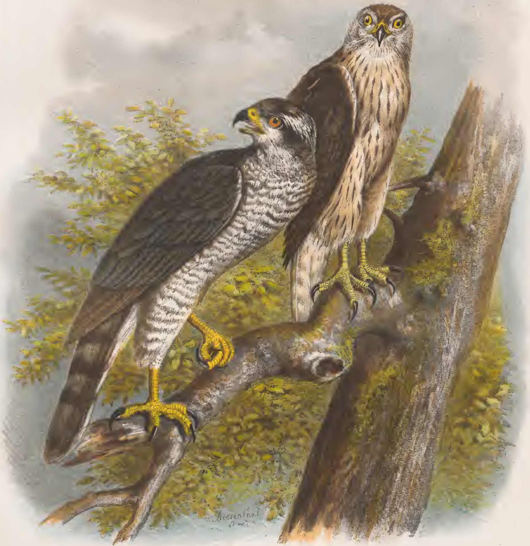
Altes Männchen. ASTUR PALUMBARIUS. Junges Weibchen Hühner-Habicht.