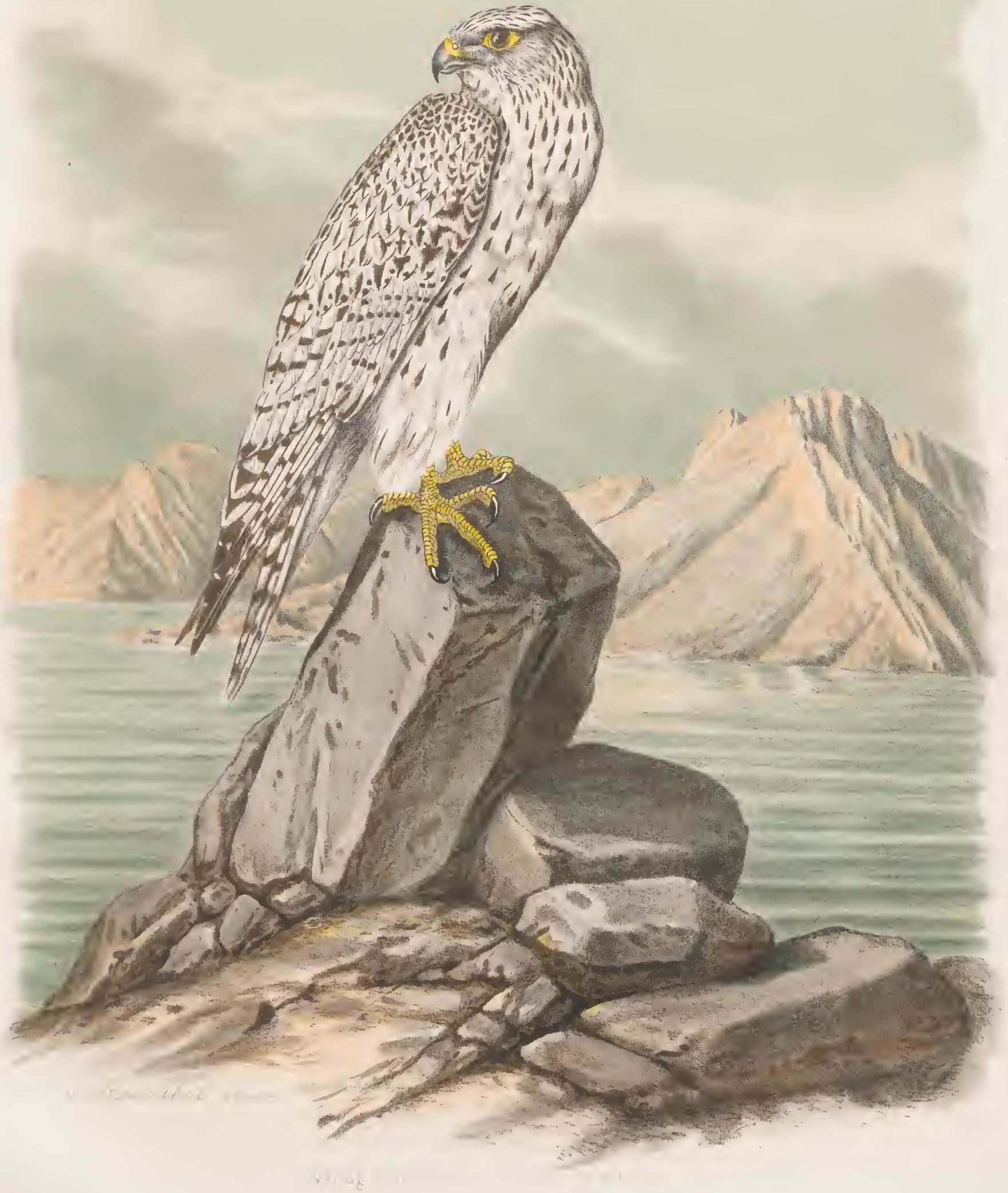
FALCO CANDIGANS, AUCT. Isfändischer Jagdfalke. Männchen.