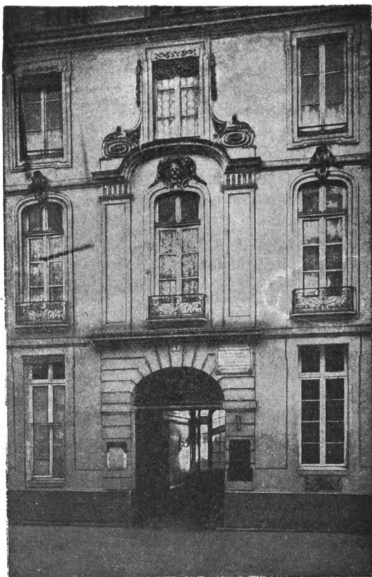
École de Psychologie (49, rue Saint-André-des-Arts.)