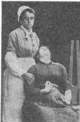
Fig. 2. — Etat léthargique provoqué par la vibration d'un diapason (Charcot).

n'ont plus conscience de ce qui se passe autour d'elles, et leurs membres conservent les diverses attitudes qu'on leur imprime. Si l'on arrête brusquement les vibrations du diapason, immédiatement se fait entendre le bruit laryngien, les membres tombent dans la résolution, et les malades sont plongées dans la léthargie. Ici la léthargie possède tous les caractères décrits précédemment. Au milieu de l'état léthargique, de nouvelles vibrations du diapason ramènent la catalepsie ».