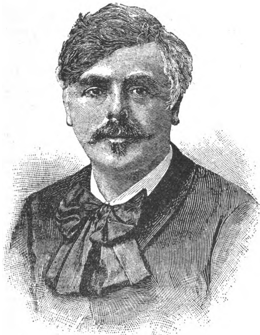
Le professeur Brissaud.

La mort du professeur Brissaud, survenue le 20 décembre dernier, a plongé dans une profonde consternation ses élèves, ses nombreux amis personnels et tous ceux qui avaient eu l'occasion d'apprécier sa haute intelligence, la noblesse de son caractère et son amour inné de la justice.