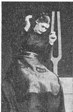
Fig. 1. — Etat cataleptique provoqué par la vibration d'un diapason (Charcot).

« La lumière dit-il n'est pas le seul agent qui puisse plonger les hystéro-épileptiques dans les états de catalepsie et de léthargie; les mêmes expériences ont été reproduites sous l'influence des vibrations sonores. Les malades Gl... et B... sont assises sur la boîte de renforcement d'un fort diapason; ce diapason, en métal de cloche, vibre soixante-quatre fois à la seconde (2). Il est mis en vibration au moyen d'une tige de bois, qui en écarte violemment les branches ou d'un archet qui frotte son extrémité ouverte. Au bout de peu d'instant, les malades entrent en catalepsie, les yeux restent ouverts, elles paraissent absorbées, elles