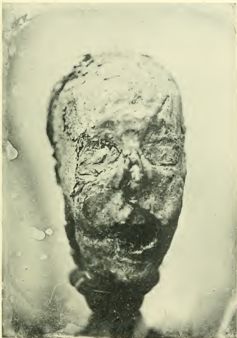
CABEZA DEL REY JAIME I. DE ARAGÓN