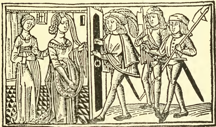
Fac-similé du titre.

La vignette est une reproduction de l'une des gravures de la Comedia de Calisto e Melibea imprimée à Burgos, en 1499, par Fadrique de Basilea.