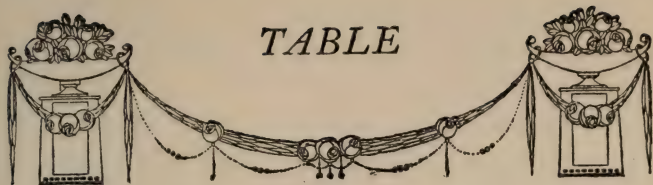
TABLE SOUVENIRS DE SERVITUDE MILITAIRE