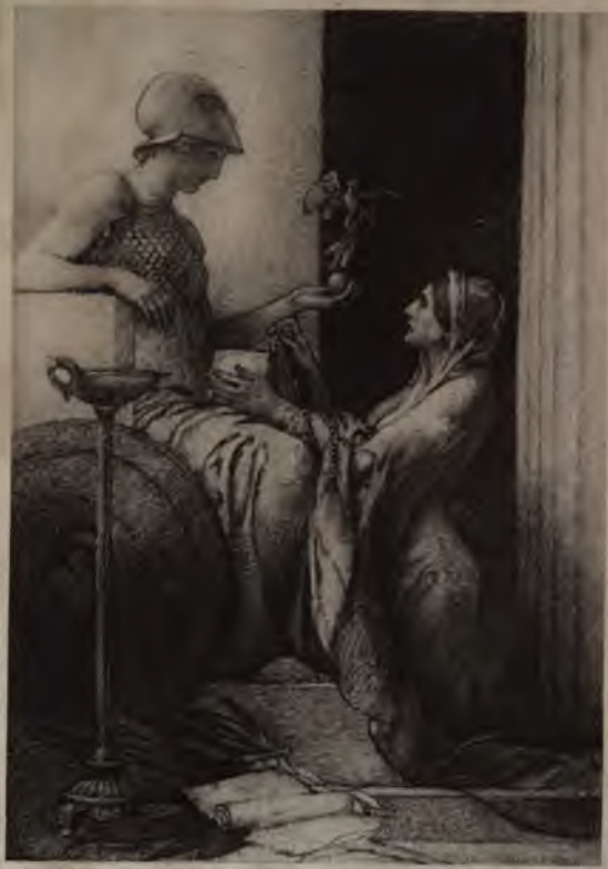
LELAND STANFORD JUNIOR UNIVERSITY