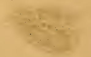
Fig 16 c