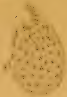
Fig 18 a