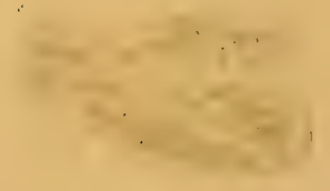
Fig 16 b