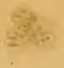
Fig 13 a