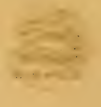
Fig 13 b