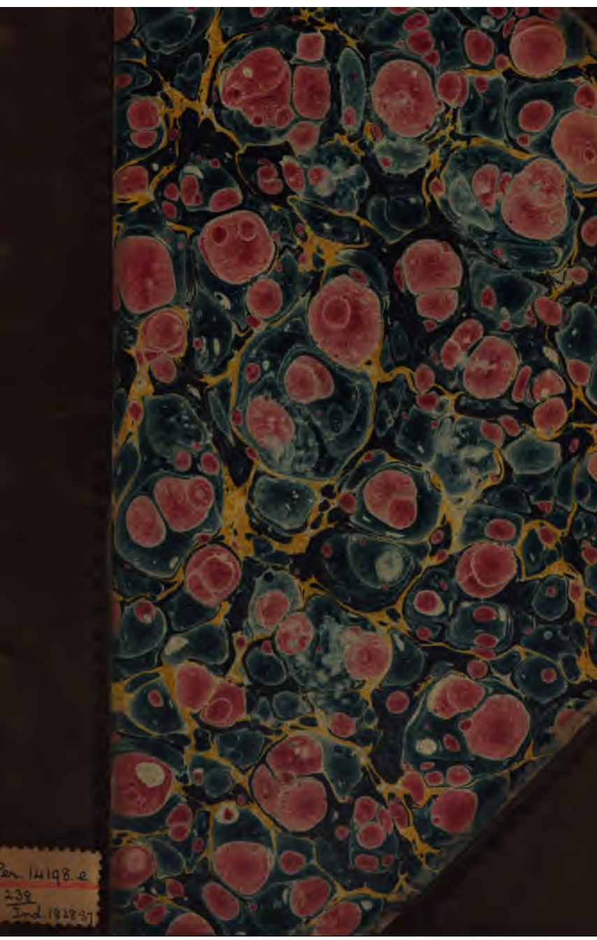
Digitized by Google