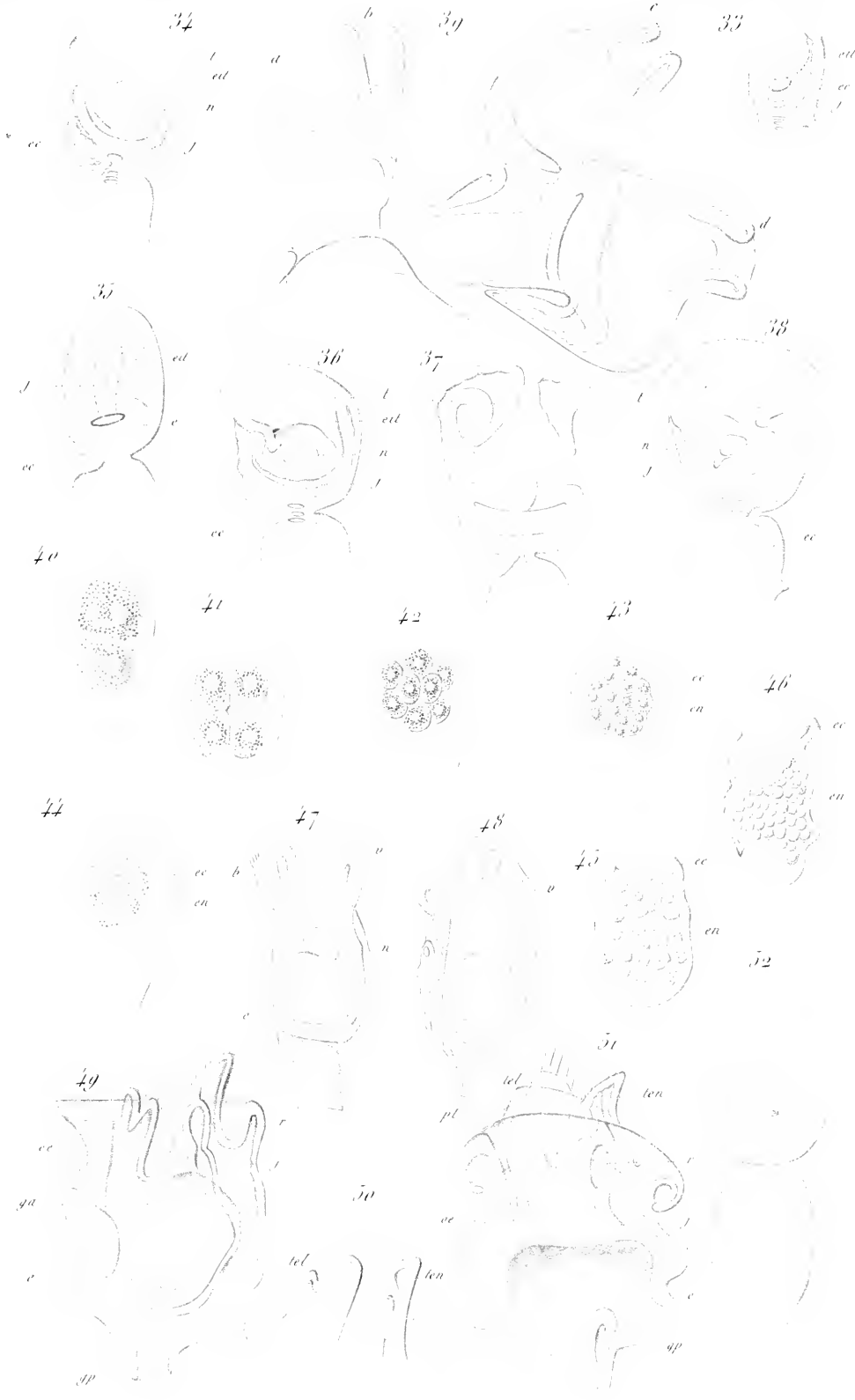
Développement des Bryozoaires.