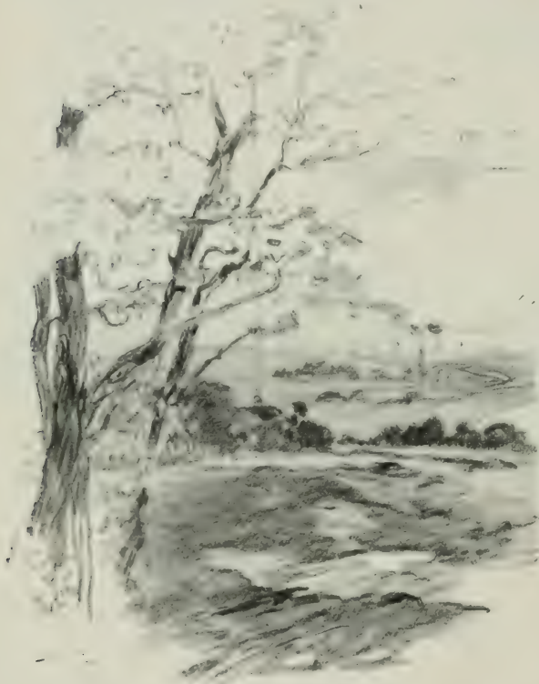
UNE NATURE SÈVE ET PASTORALE...

les habitants des environs, depuis le sous-préfet du département jusqu'à la jolie grisette qui a plissé, la veille, le jabot administratif ; depuis la noble châtelaine jusqu'au petit pâtour (c'est le mot du pays) qui nourrit sa chèvre et son mouton aux dépens des haies seigneuriales. Tout cela mange sur l'herbe, danse sur l'herbe, avec plus ou moins d'appétit, plus ou moins de plaisir ; tout cela vient pour se montrer en calèche ou sur un âne, en cornette ou en chapeau de paille d'Italie, en sabots de bois de peuplier ou en souliers de satin ture, en robe de soie ou en jupe de droguet. C'est un