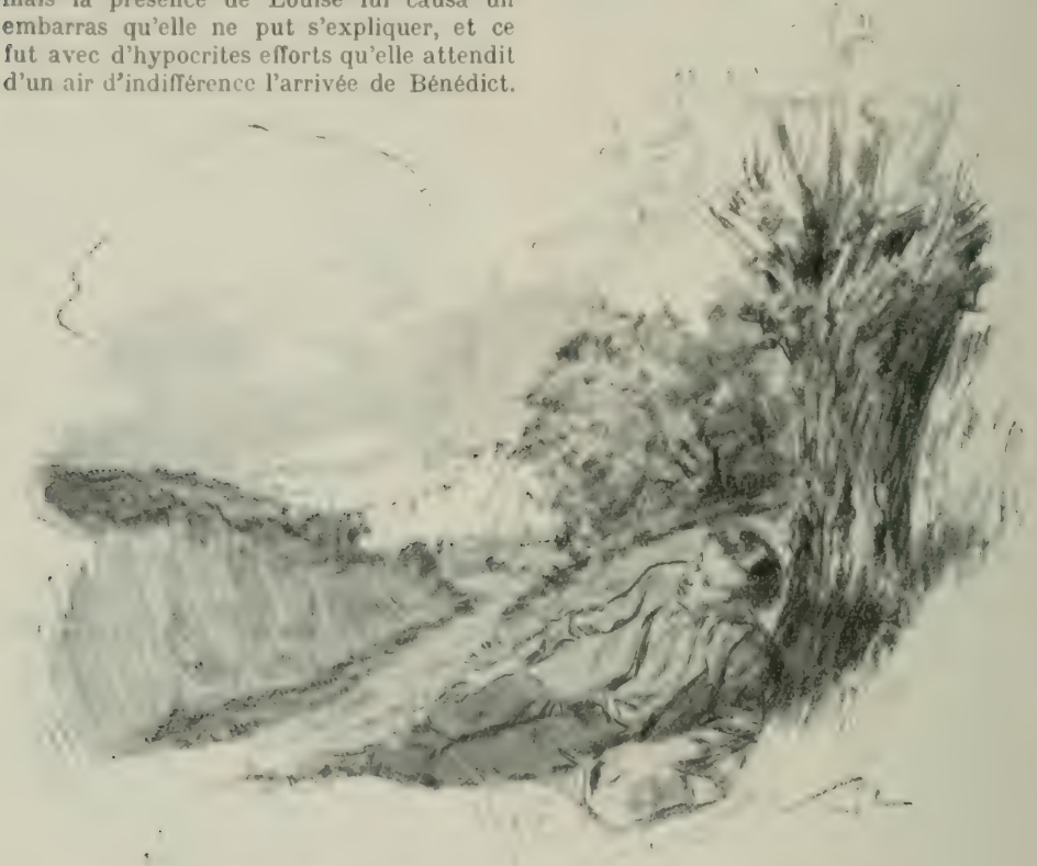
COUCHÉ DANS LE SENTIER, IL PASSAIT DES HEURES A L'ATTENDRE.

L'absence de la comtesse de Raimbault s'étant prolongée de plusieurs jours au delà