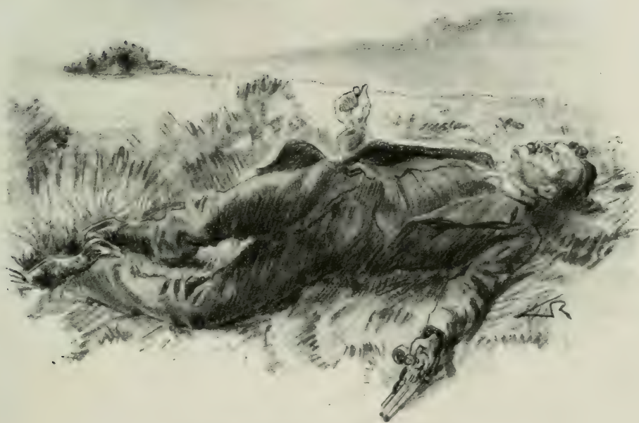
LE PISTOLET ÉTAIT ENCORE DANS SA MAIN.

— Hélas ! dit la nourrice, on ne sait ; le malheureux jeune homme a été trouvé au bout de la prairie, ce matin, au petit jour.