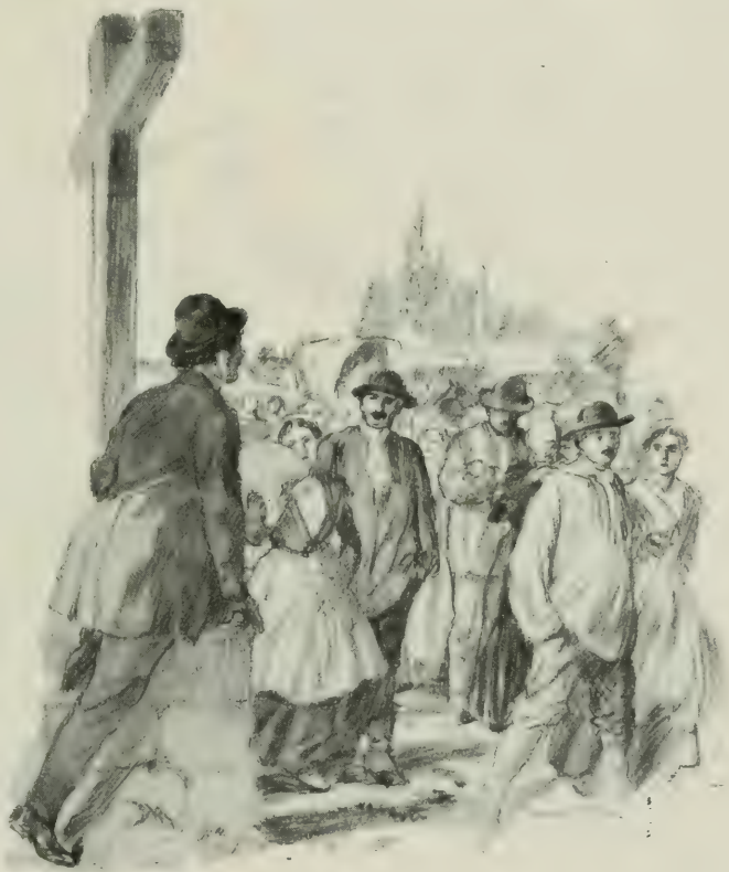
POUR LA VOIR, IL FUT FORCÉ DE MONTER SUR UN PIÉDESTAL.

Bénédicte descendit de son poste au pied de la croix, et, malgré les murmures des bonnes femmes de l'endroit, vingt autres jeunes gens se succédèrent à cette place enviée qui permettait de voir et d'être vu. Bénédicte se trouva, une heure après, porté vers mes-