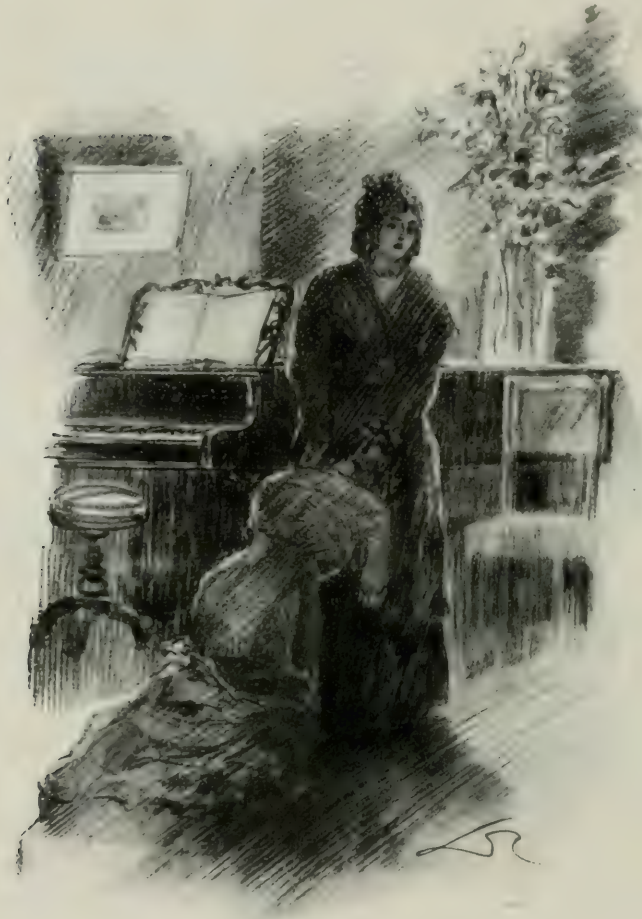
RELÈVE-TOI, VALENTINE, NE RESTE PAS AINSI À MES GENOUX.

— Tu peux me conseiller et me protéger, Louise, répondit Valentine en l'embrassant avec effusion. N'as-tu pas pour toi l'expérience, qui donne la raison et la force ? Il faut que cet homme s'éloigne d'ici ou il faut que je parte moi-même. Nous ne devons pas nous voir davantage ; car, chaque jour, le mal augmente, et le retour à Dieu devient plus difficile. Oh ! tout à l'heure je me vantais ! je sens que mon