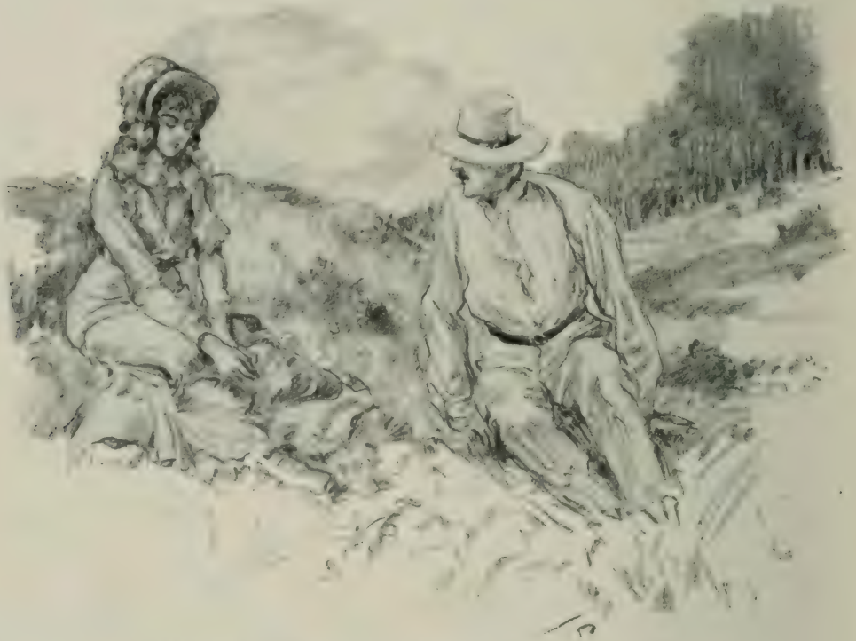
BÉNÉDICT ET VALENTINE RESTÈRENT SEULS DANS LA RAVINE.

— Non ! elle n'est pas folle, dit Louise avec sévérité, c'est vous qui êtes dur et injuste. Bénédicte, mon ami, ne troublez pas ce jour, si