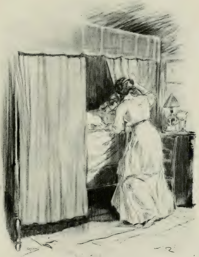
VALENTINE, EST-CE VOTRE OMBRE QUI VIENT M'APPELER ?

Valentine se laissa tomber sur une chaise.