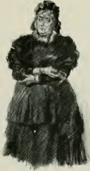
LA MARQUISE DE RAIMBAULT.

Bénédicte ne se fit pas prier plus longtemps ; la main de Valentine vint sans répugnance trouver la sienne, qui tremblait. La comtesse était satisfaite de la manière diplomatique dont son futur gendre avait arrangé l'affaire ; mais tout d'un coup le joueur de vielle, facétieux et goguenard comme le sont les vrais artistes, interrompt le refrain de la bourrée, et fait entendre avec une affectation maligne le trille impératif. Il est enjoint au nouveau danseur d'embrasser sa partenaire. Bénédicte devient pâle et perd