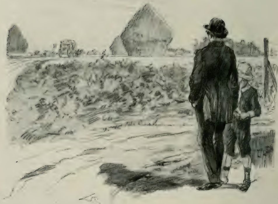
BENEDD ET VALENTIN VIRENT PASSER LA CHAISE DE POSTE QUI EMPORAIT LE NOBLE COMTE ET L'USURIER.