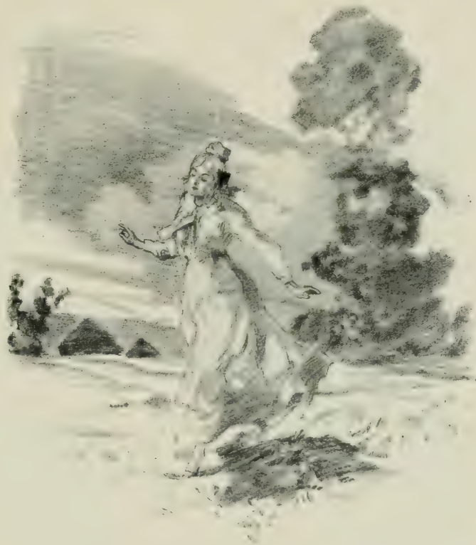
VALENTINE FRANCHIT LA PRAIRIE D'UN PIED RAPIDE.

— Tu veux donc que je t'en parle, ô ma courageuse sœur ! J'ai cru que je n'oserais jamais te rappeler son existence. Eh bien, ta grandeur d'âme surpasse tout ce que j'en espérais. Mon fils existe, il ne m'a jamais quittée ; c'est moi qui l'ai élevé. Je n'ai point essayé de dissimuler ma faute en l'éloignant de moi ou en lui refusant mon nom. Partout il m'a suivie, partout sa présence a révélé