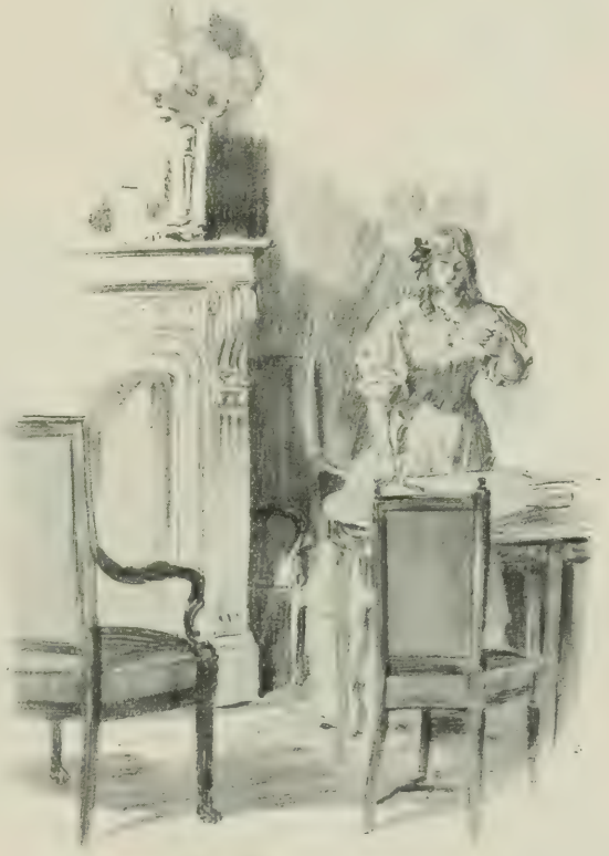
VALENTINE AVAIT TROUVÉ UNE LETTRE DE M. DE LANSAC.

Louise en parcourut quelques-unes, qu'elle trouva d'un froid mortel et d'un ridicule