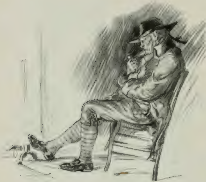
LE PERE LHÉRY.

moire, as-tu fini de donner à manger à tes canards ? Tu n'es pas encore habillée ? Nous ne partons jamais !