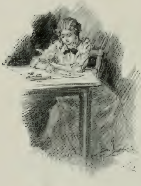
ELLE ÉCRIVIT À BÉNÉDICTE.

Je vous supplie de ne point chercher à me voir durant cette quinzaine, que je vais passer dans la famille Lhéry. Comme vous n'êtes point entré à la ferme depuis le mariage d'Athénaïs, vous n'y sauriez reparaitre maintenant sans afficher nos relations. Quelque invité que vous puissiez l'être par madame Lhéry, qui regrette toujours votre désunion apparente, refusez, si vous ne voulez m'affliger beaucoup. Adieu ; je ne sais point ce que je deviendrai, j'ai quinze jours pour m'en occuper. Quand j'aurai décidé de mon avenir, je vous le ferai savoir, et vous m'aidez à le supporter, quel qu'il soit. V.