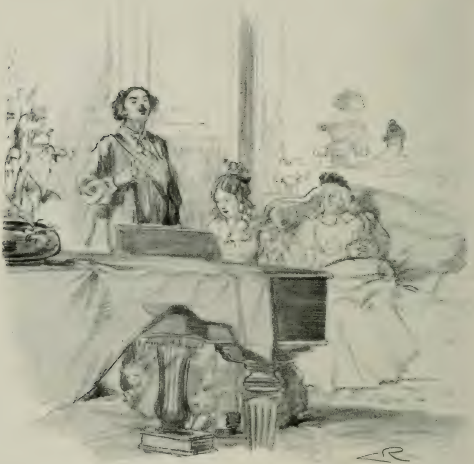
DES LES PREMIÈRES NOTES, VALENTINE ROUGIT ET PALIT.

heures auparavant. Peu à peu tout le ridicule de cette scène lui parut retomber sur la comtesse, et il arriva à la ferme en veine de gaieté. Son récit fit rire Athénaïs jusqu'aux larmes. Louise pleura en apprenant comment Valentine avait accueilli son message et reconnu la chanson que Bénédicte lui avait