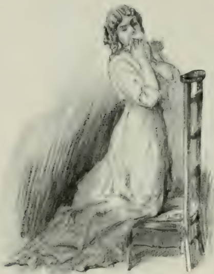
ELLE LE PRESSE CONTRE SES LÈVRES.

Tel fut le résultat de la dernière tentative de l'infortunée Valentine. La réponse de sa mère jeta une telle douleur dans son âme,