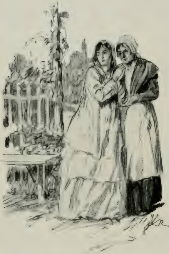
APPUYÉE SUR LE BRAS DE SA NOURRICE...

— Tout de suite, ma pauvre enfant ? dit le médecin en souriant. Eh ! voyez donc ces flambeaux ! il est deux heures du matin ; mais si vous voulez me promettre d'être sage et de bien dormir, et de ne pas reprendre la fièvre d'ici à demain, nous irons dans la matinée faire une promenade dans le bois de Vavray. Il y a, de ce côté-là, une petite maison où vous porterez l'espoir et la vie.