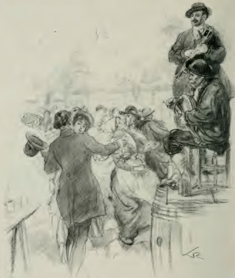
IL EST ENJOINT AU NOUVEAU DANSEUR D'EMBRASSER SA PARTENAIRE.

charmait de coquetterie; sa beauté était du genre de celles qui plaisent plus généralement. Les hommes d'une éducation vulgaire aiment les grâces qui attirent, les yeux qui préviennent, le sourire qui encourage. La jeune fermière trouvait dans son immo-