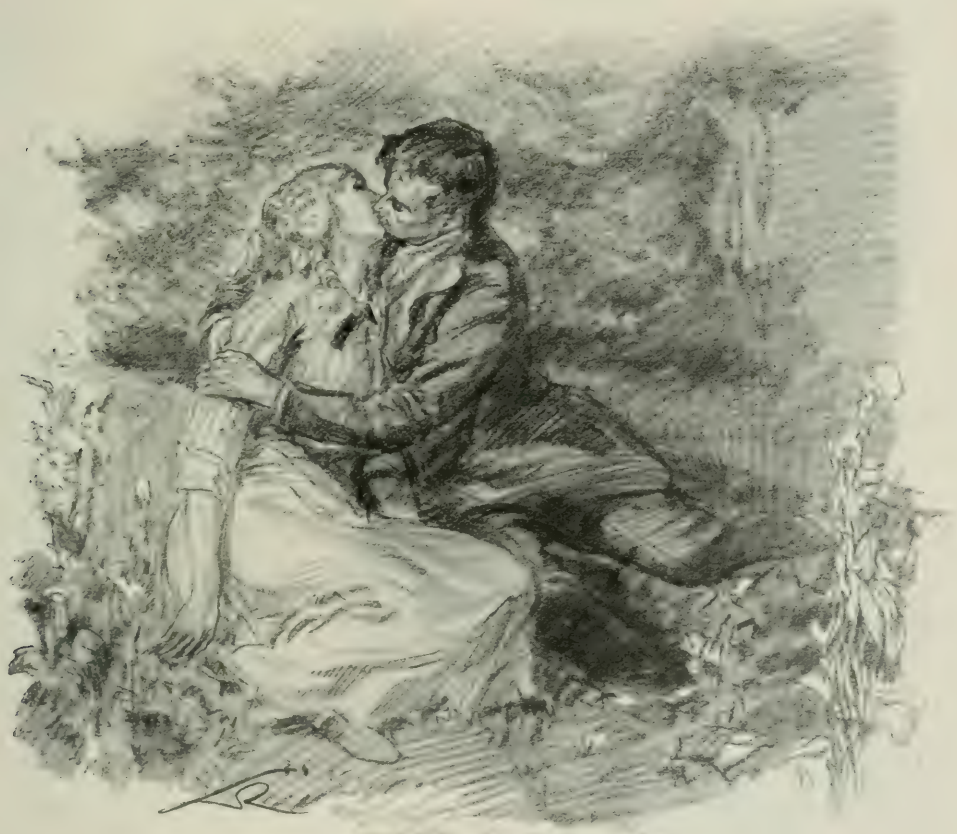
LEURS LÈVRES SE RENCONTRÈRENT...

Ce noble orgueil d'elle-même, auquel Valentine avait encore droit, acheva d'aigrir celle qui se livrait trop aveuglément peut-