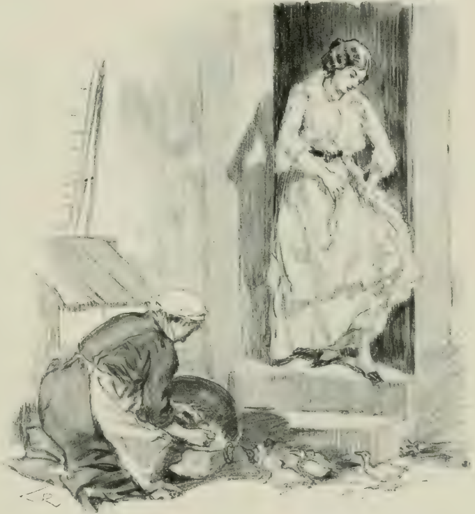
ELLE ARRANGEAIT LES PLIS DE SA ROBE.

A l'autre bout de la chambre, un jeune homme habillé de noir, assis négligemment sur un canapé, contemplait Athénaïs en silence. Mais son visage n'exprimait pas cette joie expansive, enfantine, que trahissaient tous les mouvements de la jeune fille. Parfois même une légère expression d'ironie et de pitié semblait animer sa bouche grande, mince et mobile.