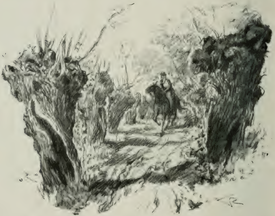
DE GROS SAULES ÉBRANCHÉS SE DRESSAIENT AUX DEUX CÔTÉS DE LA HAIE.

Mais elle vit bientôt que le chemin descendait de plus en plus rapidement vers le fond de la vallée. Elle ne connaissait point le pays, qu'elle avait à peu près abandonné depuis son enfance, et pourtant il lui sembla que, dans la matinée, elle avait côtoyé la