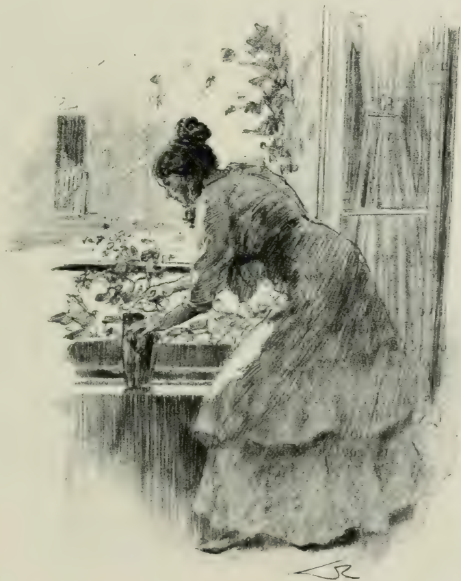
ATHÉNAÏS AVAIT MIS DES FLEURS NOUVELLES...

Lorsqu'elle se vit à la ferme, entourée de poules, de chiens de chasse, de chevreaux ; lorsqu'elle vit Louise filant au rouet ; madame