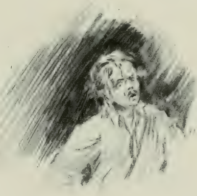
IL LUI SEMBLAIT VOIR LE SPECTRE SANGLANT...

Valentine, récemment éprouvée par une maladie de nerfs très violente, était encore en proie, à de certaines heures, à une sorte d'exaltation fébrile. Ces heures-là, Bénédicte les passait auprès d'elle, et il chantait. Valentine avait le frisson, tout son sang affluait à son cœur et à son cerveau ; elle passait d'une chaleur dévorante à un froid mortel. Elle tenait son cœur sous ses mains pour l'empêcher de briser ses parois, tant il palpitait avec fougue, à de certains sons partis de la poitrine et de l'âme de Bénédicte. Lorsqu'il chantait, il était beau, malgré ou plutôt à cause de la mutilation de son front. Il aimait Valentine avec passion, et il le lui avait bien prouvé. N'était-ce pas de quoi l'embellir un peu ? Et puis ses yeux avaient un éclat prestigieux. Dans l'obscurité, lorsqu'il était au piano, elle les voyait scintiller