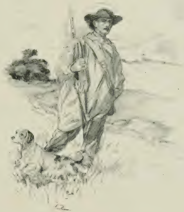
IL PARTIT ÉQUIPÉ EN CHASSEUR VILLAGEOIS.

Hautain et fier, il n'avait jamais voulu s'y présenter pour traiter d'aucune affaire au nom de son oncle ; mais, pour Louise, pour Valentine, pour ces deux femmes qu'il ne