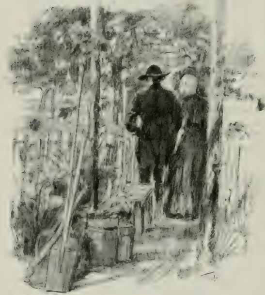
ILS S'ENFONCERENT DANS UNE ALLÉE DU JARDIN.