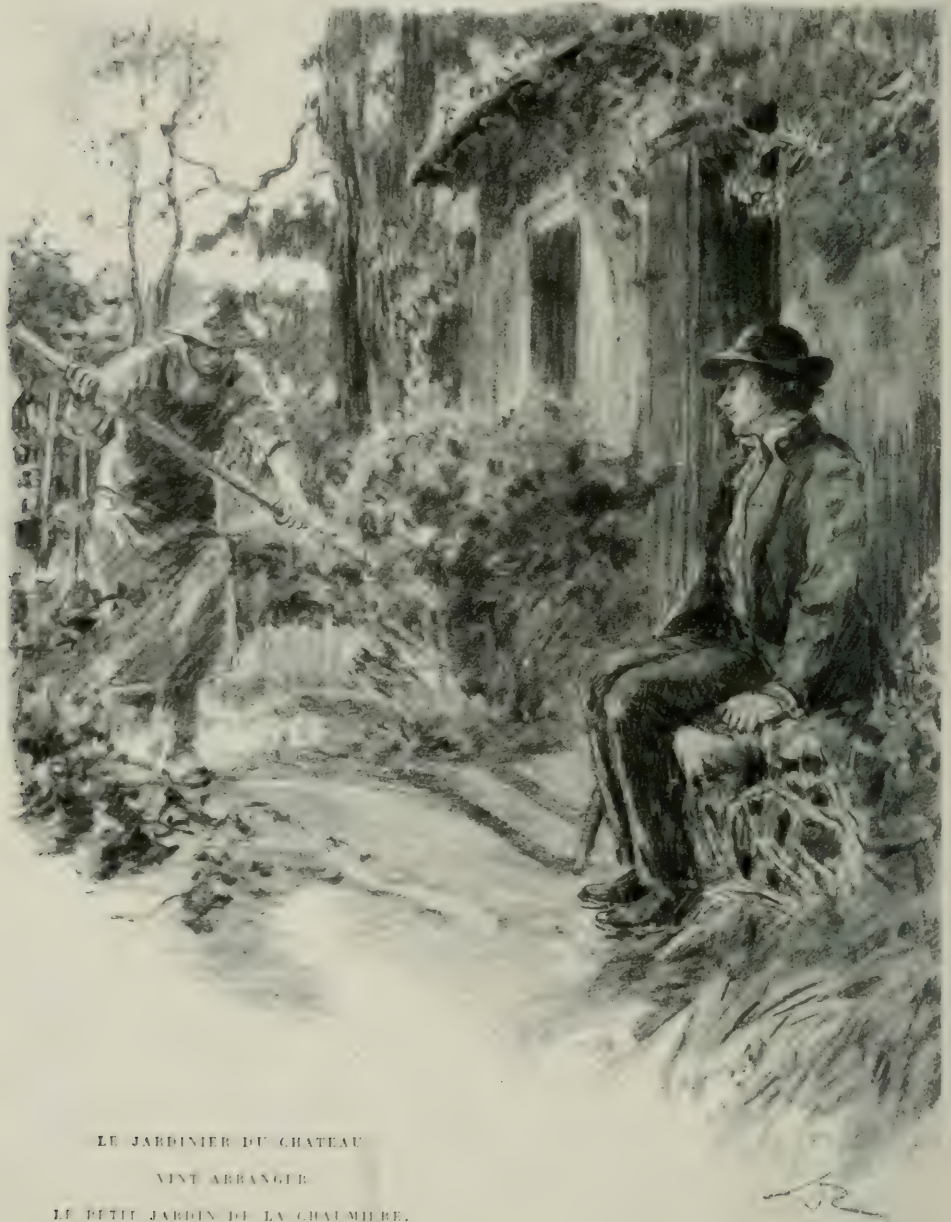
LE JARDINIER DU CHATEAU

quentes visites de Bénédicte au château, le genre de vie mystérieuse et retirée de madame de Lansac. Quelques vieilles femmes qui, du reste, détestaient cordialement madame