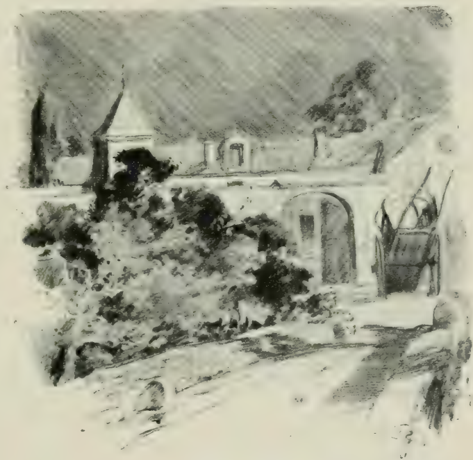
LA FERME DE GRANGENEUVE.