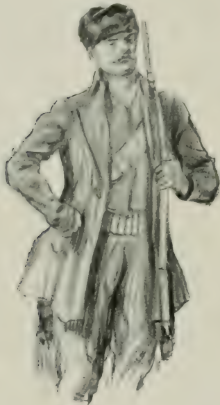
LE CHEVALIER DE TRIGAUD.

Le lendemain, vers six heures du matin, au moment où l' Angelus sonnait au fond de la vallée et où le soleil enluminaït tous les toits d'alentour, Joseph se dirigea vers la partie du pays la plus déserte, et en même temps la mieux cultivée ; c'était sur les terres de Raimbault, terres considérables et fertiles, jadis vendues comme biens nationaux, rachetées sous l'Empire par la dot de mademoiselle Chignon, fille d'un riche manufacturier, que le général comte de Raimbault avait épousée en secondes noces. L'Empereur aimait à unir les anciens noms aux nouvelles fortunes ; ce mariage s'était conclu sous son