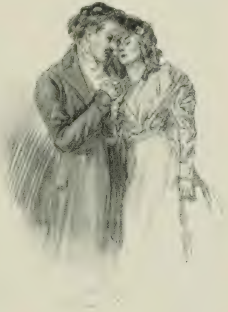
II. LA PRESSA CONTRE SON CŒUR.

l'âge où l'on s'en passe le mieux ; mais on ne saurait nier que l'aspect des objets extérieurs n'ait une influence immédiate sur nos pensées, et ne détermine le plus souvent la teinte de notre humeur. Or, la ferme avec son désordre et ses contrastes était un lieu de délices, en comparaison de l'ermitage de Bénédicte. Les murs bruts, le lit de serge en forme de corbillard, quelques vases de cuisine en cuivre et en terre, disposés sur des rayons, le pavé en dalles calcaires inégales et ébréchées de tous côtés, les meubles grossiers, le jour rare et gris qui venait de quatre carreaux irisés par le soleil et la pluie, ce n'était pas là de quoi faire éclore des rêves brillants. Bénédicte