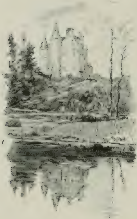
LE CHATEAU DE RAIMBAULT.

Deux heures s'étaient écoulées rapidement, non seulement à se rappeler le passé, mais encore à faire des projets pour l'avenir. Valentine y portait toute la confiance de son âge ; Louise y croyait moins, mais elle ne le disait pas. Une ombre noire se dessina tout d'un coup dans l'air bleu au-dessus du fossé.