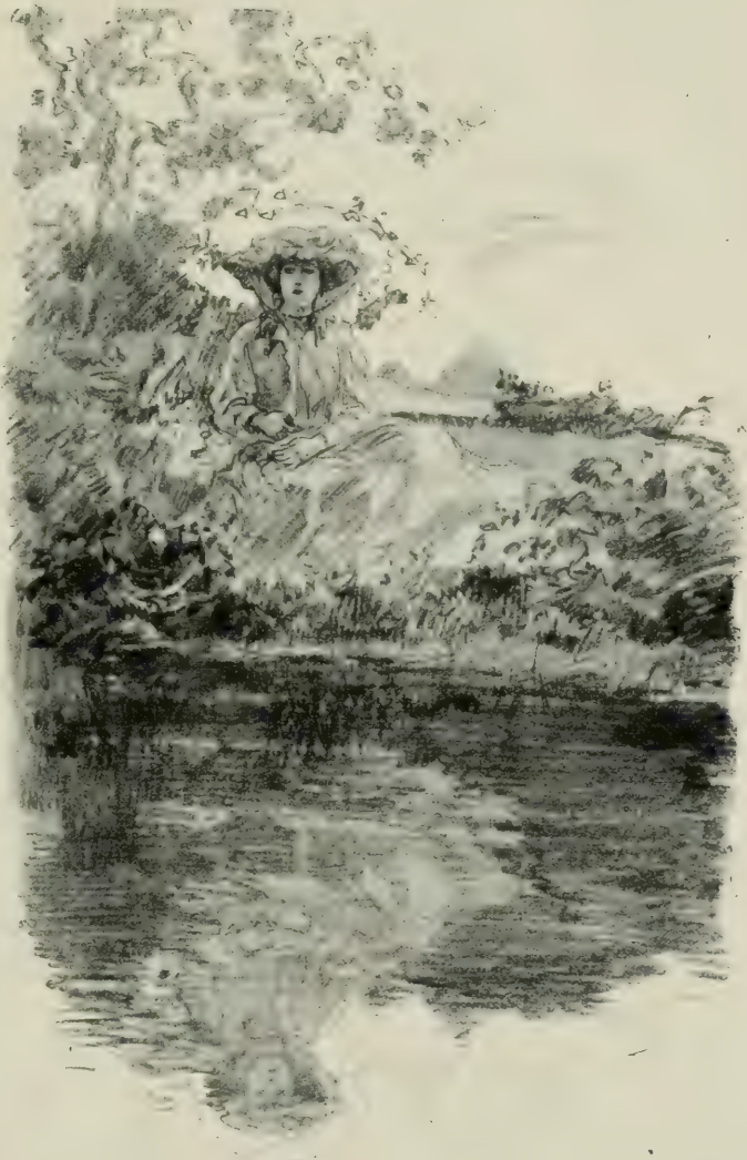
L'IMAGE DE VALENTINE ÉTAIT RÉFLÉCHIE DANS L'ONDE IMMOBILE.

semblaient ne saisir aucun objet. Le fait est qu'ils saisissaient parfaitement l'image de Valentine réfléchie dans l'onde immobile. Il se plaisait à cette contemplation dont l'objet s'évanouissait chaque fois qu'une brise légère