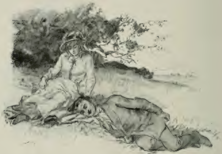
IL SE COUCHAIT SUR L'HERBE À SES PIEDS, LA TÊTE APPUYÉE SUR SON TABLIER DE SOIE...

Mais, tout bien considéré, la chose lui plaisait mieux ainsi qu'autrement. Il s'était marié avec la ferme résolution de ne pas s'embarrasser de madame de Lansac, et, pour le moment, il entretenait avec une première danseuse du théâtre de Saint-Petersbourg des relations qui lui faisaient envisager très philosophiquement la vie. Il trouvait donc fort juste que sa femme se créât de son côté des affections qui l'enchaînaient loin de lui