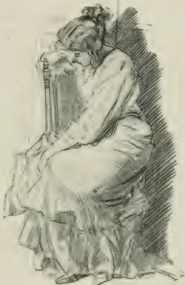
VALENTINE RÉFLÉCHIT AVEC CALME...

Il était à peine cinq heures du matin ; le comte avait espéré quitter le château avant que sa femme fût éveillée. Il se flattait d'échapper ainsi à l'ennui de nouveaux adieux et de nouvelles dissimulations. L'idée de cette entrevue le contraria donc vivement ;