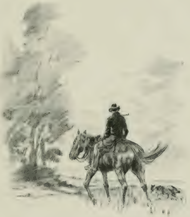
BÉNÉDIC REPRIT SEUL SON CHEMIN.

— Voilà une jolie fête, une charmante partie de plaisir! lui dit-elle. C'est vous qui l'avez voulu; vous m'avez amenée ici à mon corps défendant. Vous aimez la canaille, vous; mais, moi, je la déteste. Vous êtes-vous bien amusée, dites? Extasiez-vous donc