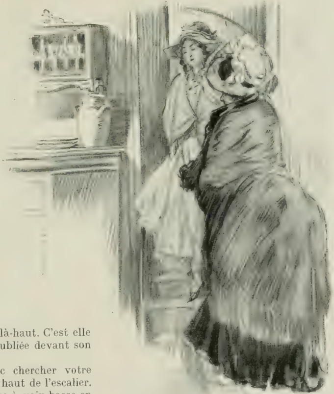
MADAME LHÉRY REPARUT...

Le père Lhéry mit son chapeau sur ses genoux afin de ne pas l'exposer aux cahots de la voiture en le gardant sur sa tête. Bénédicte monta sur la banquette de devant, et, en prenant les rênes, osa jeter un dernier regard sur Louise ; mais il rencontra tant de