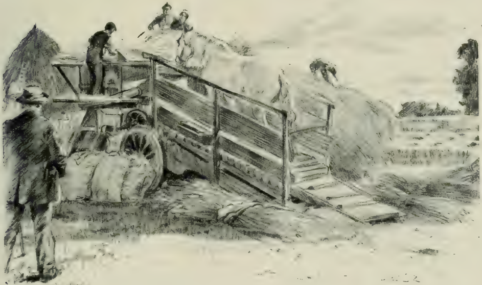
LA JOURNÉE FUT EMPLOYÉE A VISITER LA PROPRIÉTÉ.

— Je veux dire que j'ai aussi, moi, une femme jeune et jolie. Avec de l'argent, qu'est-ce qu'on n'a pas ? Eh bien, quand j'ai fait une absence de quinze jours seulement, quoique ma maison soit aussi grande que la vôtre, ma femme, je veux dire mon épouse, n'occupe pas le premier étage tandis que j'occupe le rez-de-chaussée. Au lieu qu'ici, monsieur... Je sais bien que les ci-devant nobles ont conservé leurs anciens usages, qu'ils vivent à part de leurs femmes ; mais,