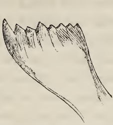
Linker Oberkiefer einer Formica rufa . (Arbeiterin.) (Stark vergrößert.)

zum Festdrücken der Erdklümpchen mithelfen. Die Form dieser Werkzeuge, besonders des maßgebenden gezähnten Vorderrandes (Kaurandes), ist bei nahe verwandten Ameisenarten meist so ähnlich 1 , daß die spezifische Verschiedenheit des Baustils nur durch die instinctive Vorliebe der einzelnen Ameisenarten für ihre besondere Bauart erklärt werden kann.