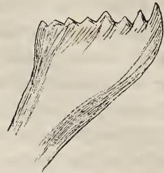
Rechter Oberkiefer einer Formica sanguinea . (Arbeiterin.) (Ebenso stark vergrößert.)

Mit einem mechanischen Automatismus der thierischen Thätigkeiten, welcher die Verschiedenheit der Instincte bloß aus der Verschiedenheit der körperlichen Werkzeuge begreiflich machen will, kann man bei den Ameisen nicht fertig werden: das eigentlich Maßgebende ist die psychische Mannigfaltigkeit der Instinctanlagen; durch sie werden die an sich indifferenten körperlichen Instrumente zu dieser oder jener Thätigkeit bestimmt.