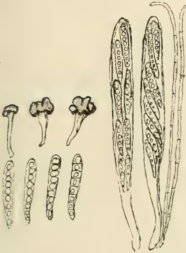
Cudonia Osterwaldi n. sp.

lato-sublobatis, atro-castaneis, pruinosis, humido haud viscosis, margine involutis repandis, 1\frac{1}{2} —6 \mu diam., extus pallidis; stipite clavato, interdum tereti, fistuloso, saepe curvato, pallido, pruinoso, 0,3—1 cm \times 1—2 \frac{1}{2} \mu , basi attenuato; ascis subfusoido-clavatis, apice attenuatis, rotundato-obtusis, pedicellatis, 70—100 \times 7—10 \mu , 8 sporis; paraphysibus copiosis obvallatis, filiformibus, septatis, interdum apice flexuoso-curvatis, 2 \mu crassis, subviolaceo-brunneolis, epithecio violaceo-brunneo; sporis oblique monostichis vel subdistichis, clavatis, apice rotundatis, basi subobtusiusculis, 6—10 guttulis, dein 5—9 septulatis, hyalinis, 18—32 \times 3 \frac{1}{2} —4 \mu .