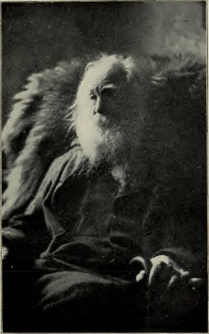
Whitman im zweiundsiebzigsten Lebensjahre