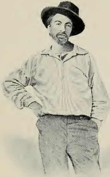
Bildnis von 1855 aus der Erstausgabe der „Grashalme“