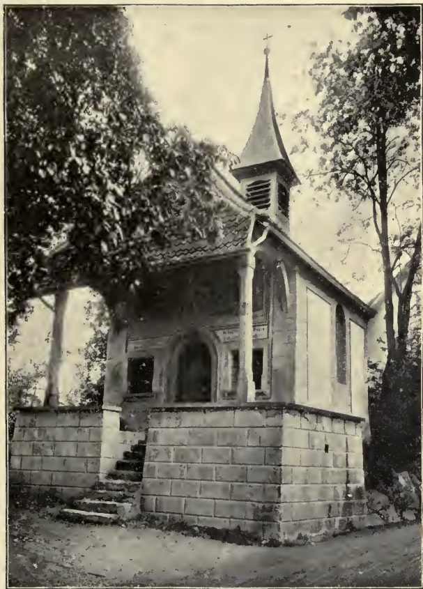
THE TELL CHAPEL AT KÜSSNACHT. Act IV, Sc. 3.