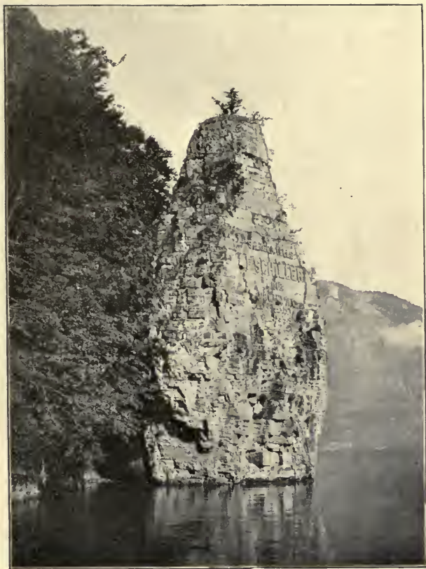
THE SCHILLER STONE. Act V, Last Scene.