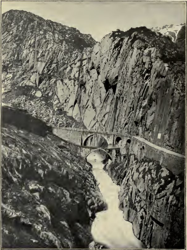
THE REUSS WITH THE TEUFELSBRÜCKE. Act V, Sc. 2.