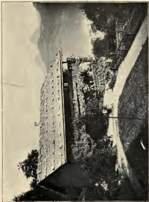
THE RÜTLI. Act II, Sc. 2.