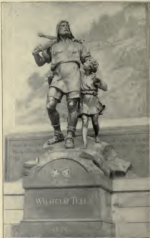
THE TELL STATUE AT ALTORF. Act III, Sc. 3.