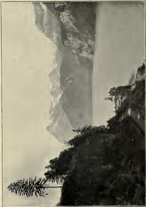
THE URIROSTOCK FROM THE AXENSTEIN. Act I, Sc. I.