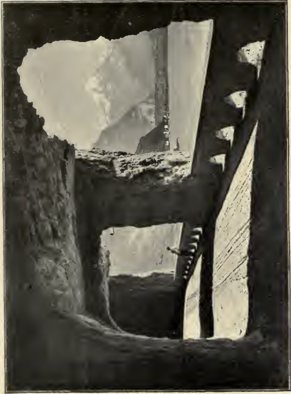
THE AXENSTRASSE WITH FLÜELEN IN THE DISTANCE. Act IV, Sc. 1.