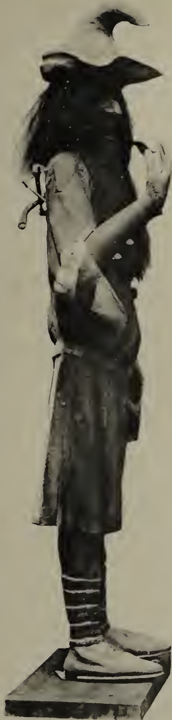
Der Roraffe im Straßburger Münster