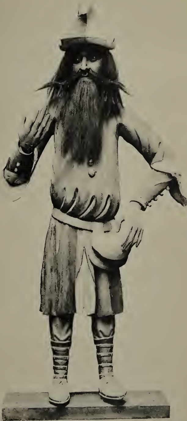
Der Roraffe im Straßburger Münster Vorderansicht