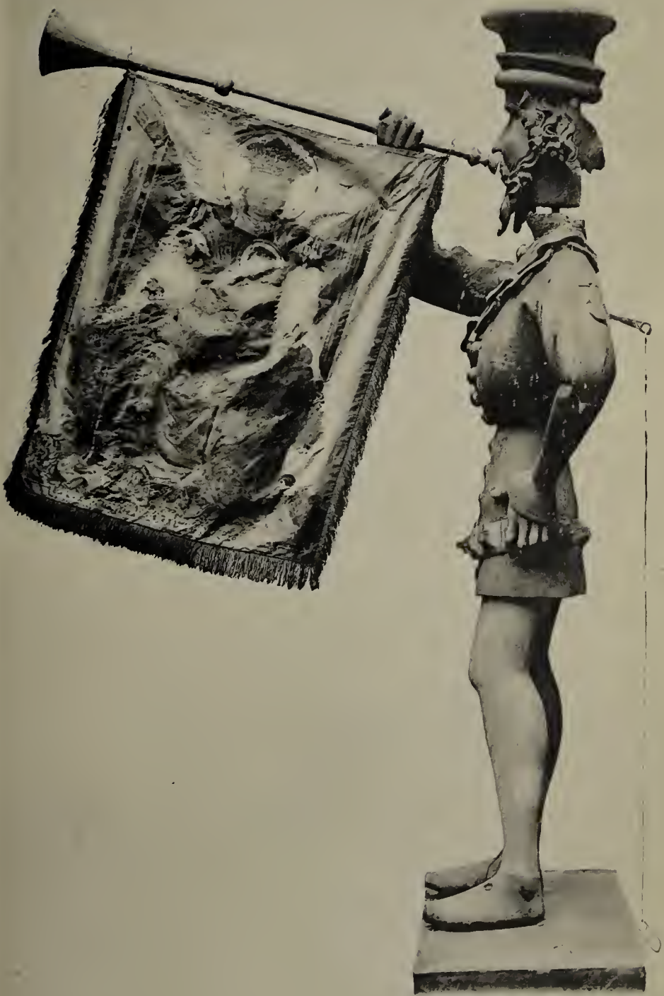
Der Trompeter (Roraffe) im Straßburger Münster