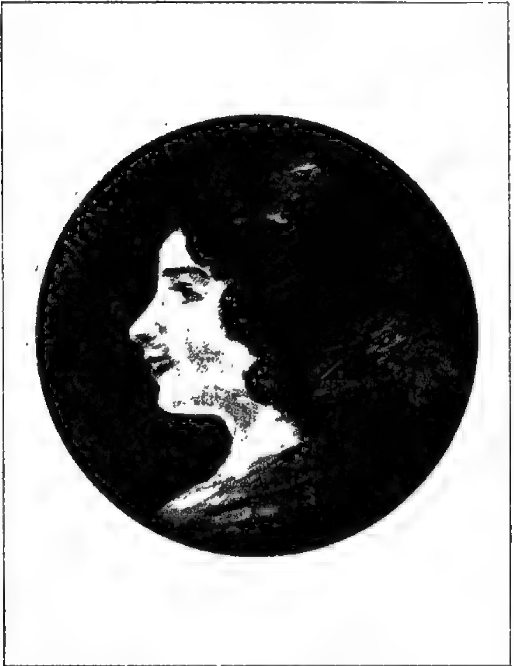
„Mädchenkopf“, medianime Zeichnung von Adolfo.