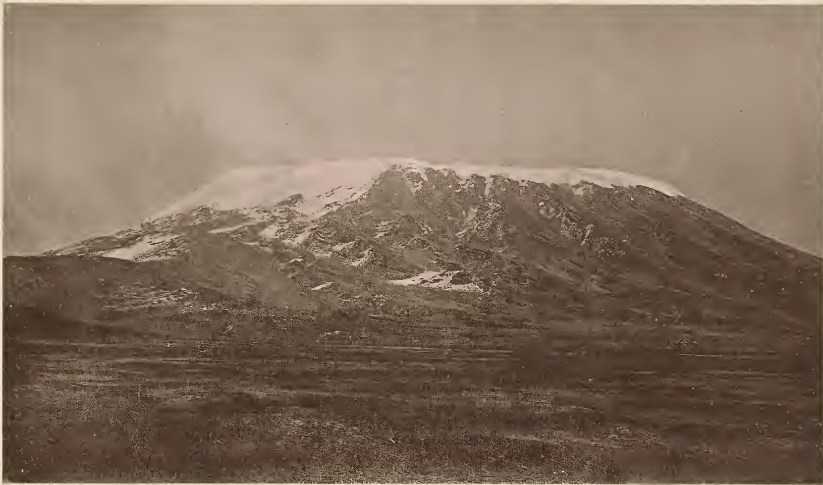
9. DER KIBO; VON DER MITTE DES SATTELPLATEAUS (4350 m) AUS NO. GESEHEN.