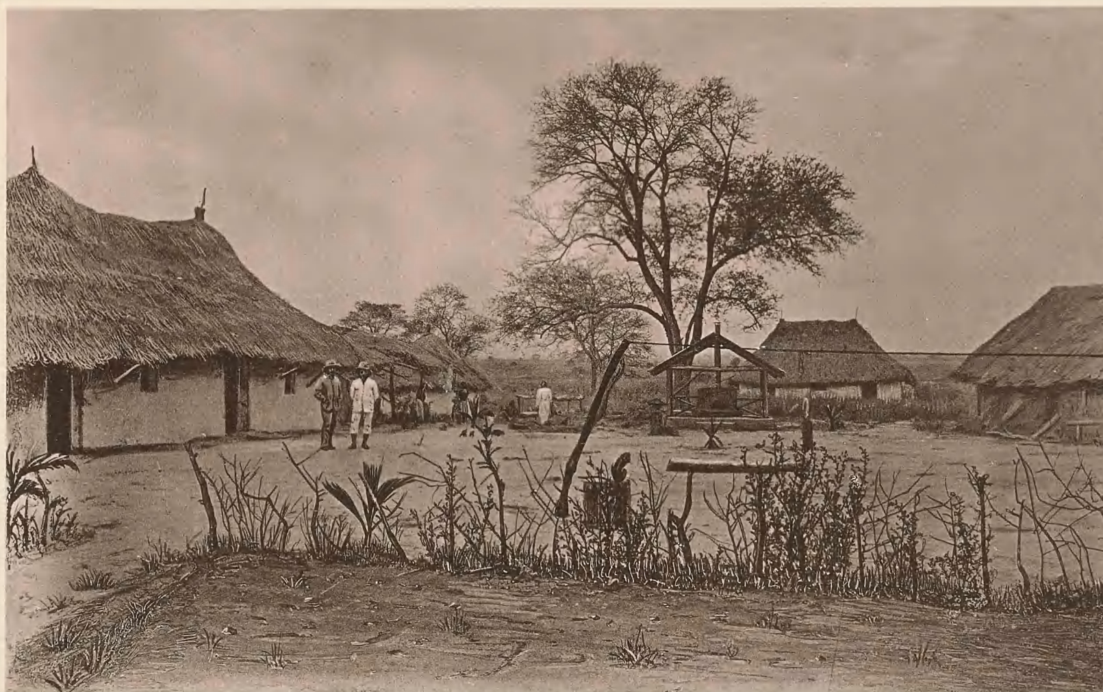
38. DIE STATION MADIMOLA DER D.-O.-A. GESELLSCHAFT.