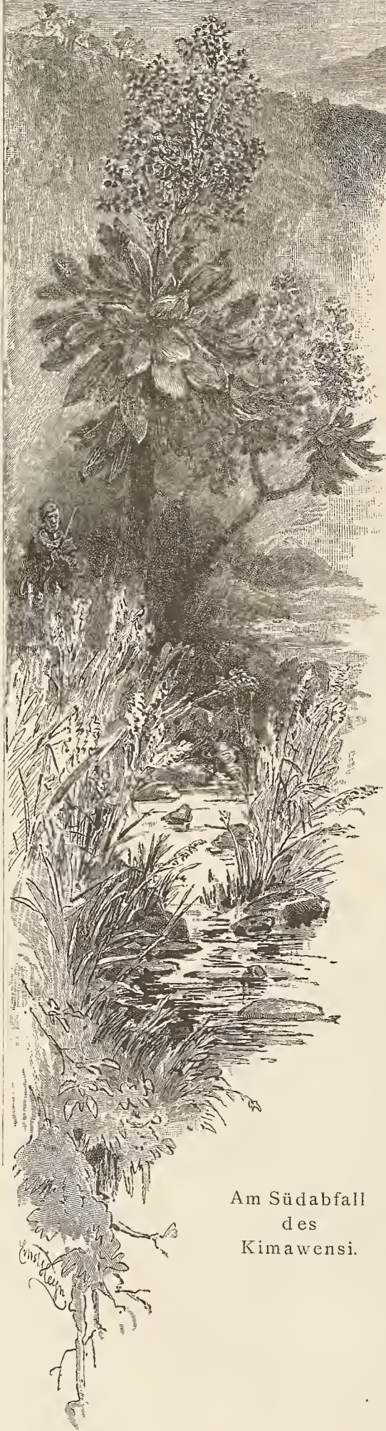
Am Südabfall des Kimawensi.

Trotz der starken Anzweiflung, welche Rebmanns und Krapfs Berichte besonders durch den englischen Pedanten Desborough Cooley erfuhren, ward doch ein Jahrzehnt später die Richtigkeit ihrer Ent-