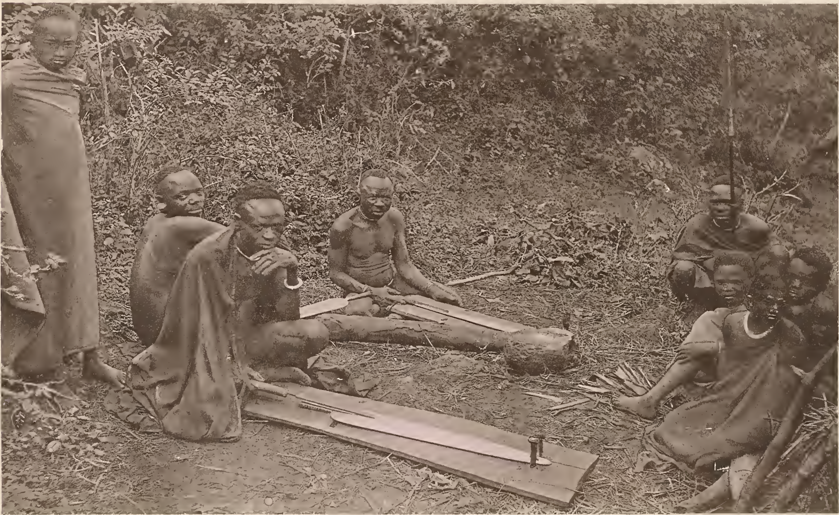
26. SCHWERTFEGER DES FÜRSTEN MAREALE VON MARANGU.