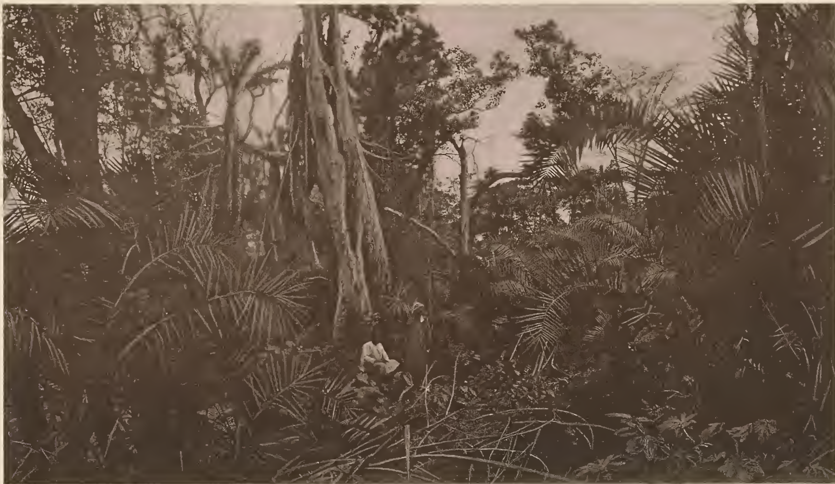
2. URWALD VON TAWETA.