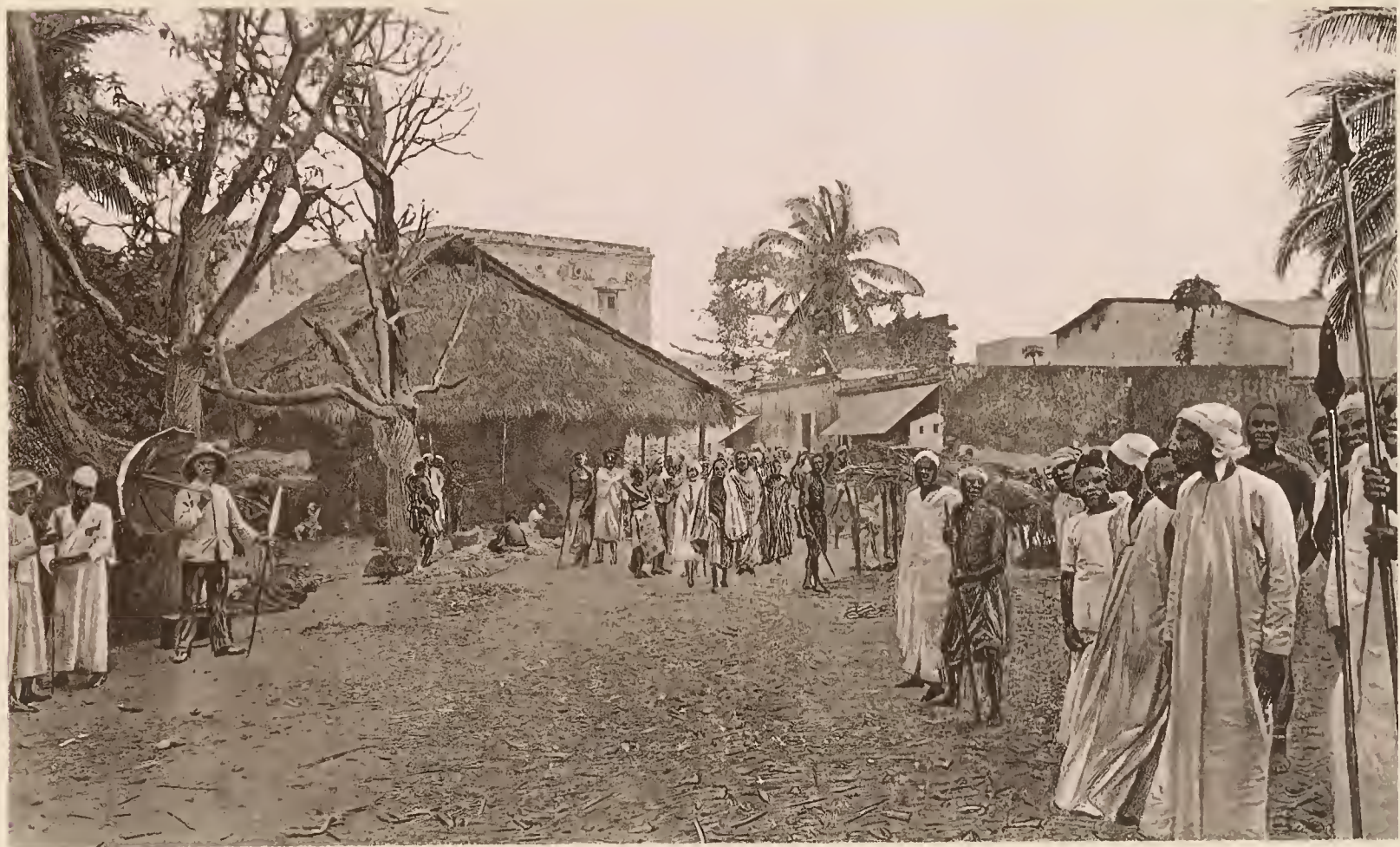
40. EINE STRASSE IN BAGAMOYO.