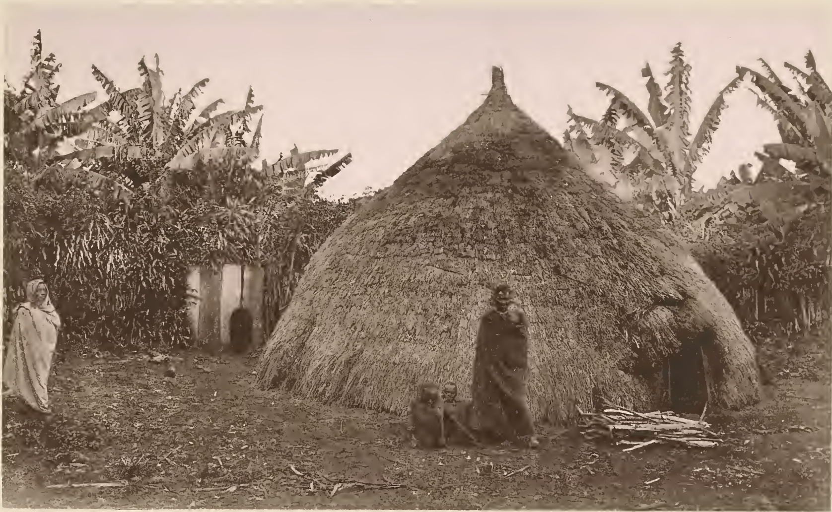
17. HÜTTE VON MAREALES LIEBLINGSBRUDER IN MARANGU.