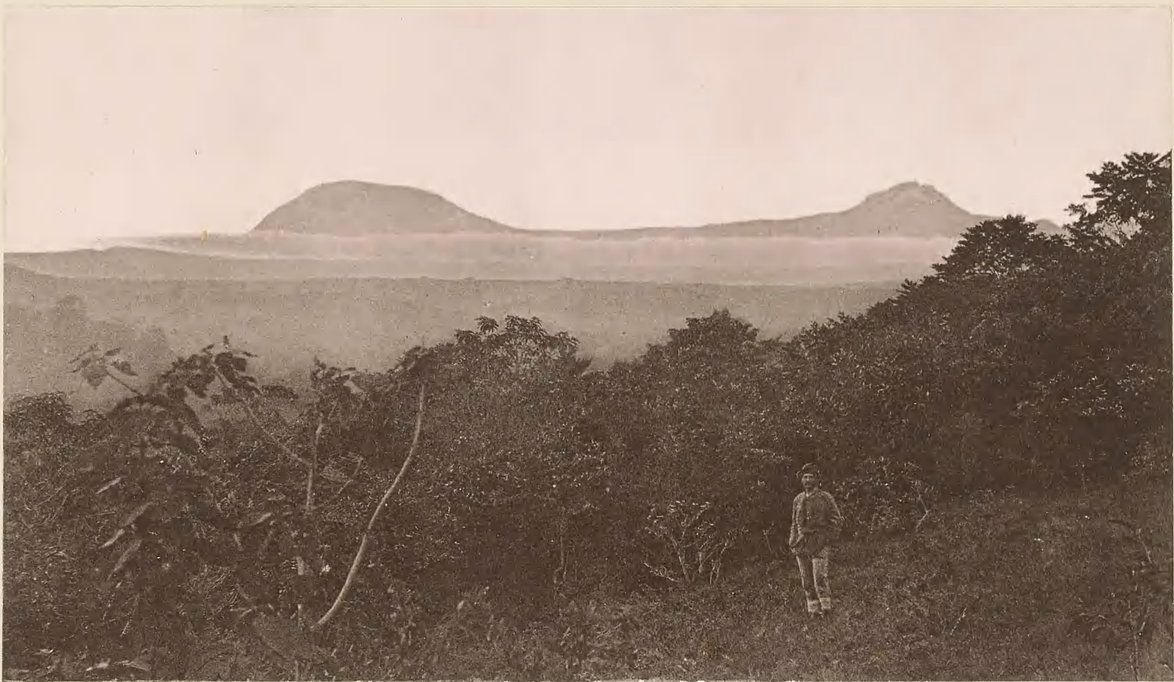
4. DER KILIMANDSCHARO; VON MARANGU AUS SO. GESEHEN.