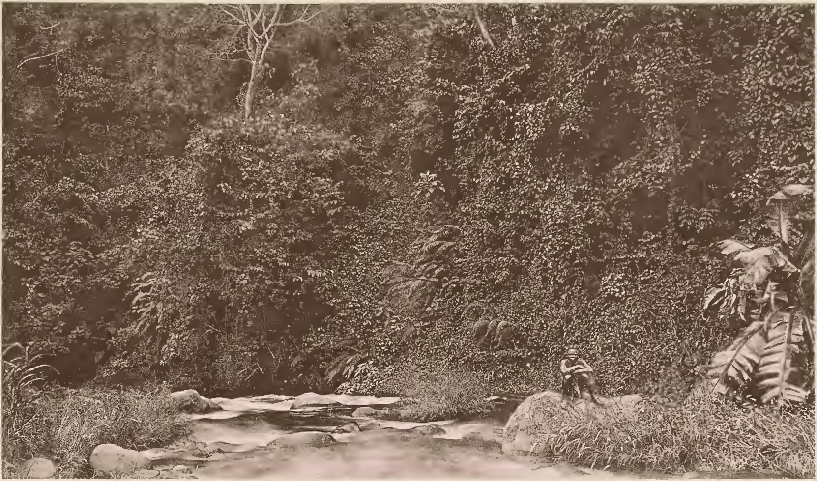
5. URWALD IM OBERN TEIL VON MARANGU.