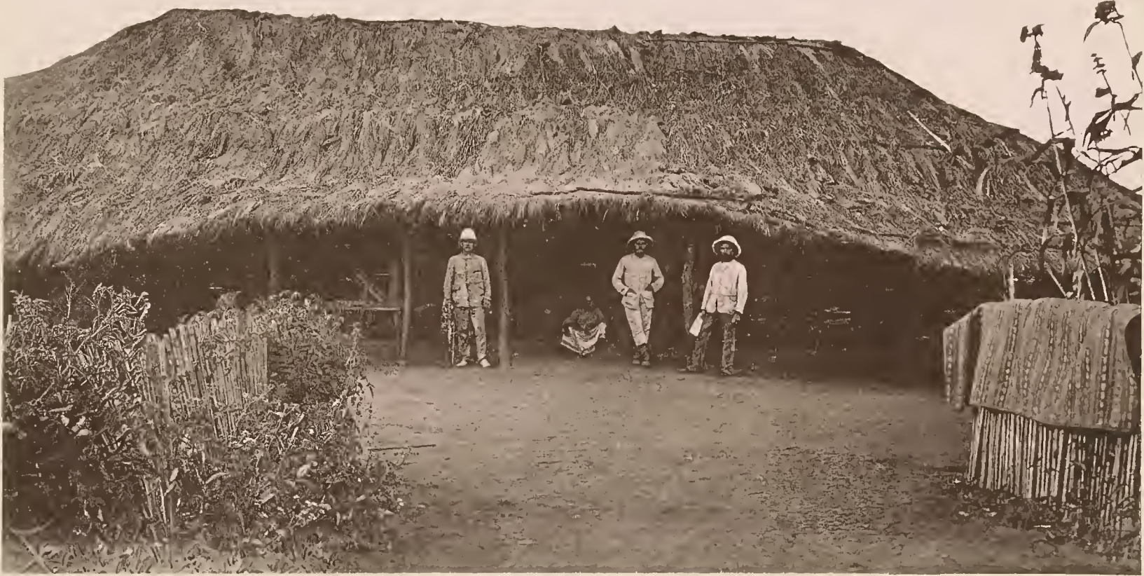
31. DIE STATION KOROGWE DER D.-O.-A. GESELLSCHAFT, VORDERANSICHT DES HAUPTGEBÄUDES.