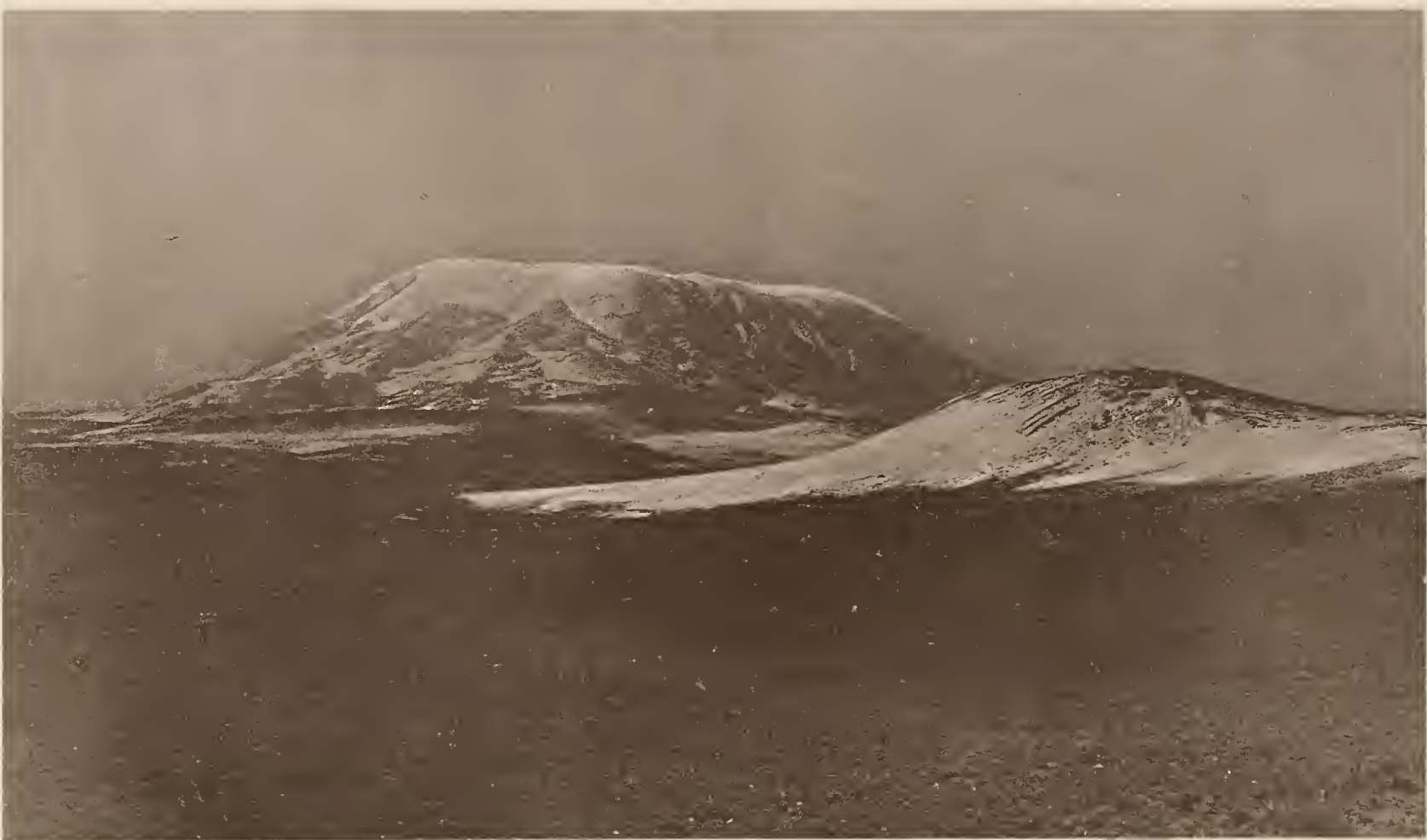
8. DER KIBO; VON DER SÜDSEITE DES SATTELPLATEAUS (4350 m) AUS O. GESEHEN.