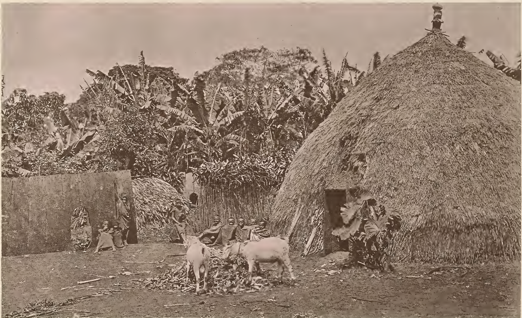
18. WOHNHÜTTE VON MAREALES HAUPTFRAU.