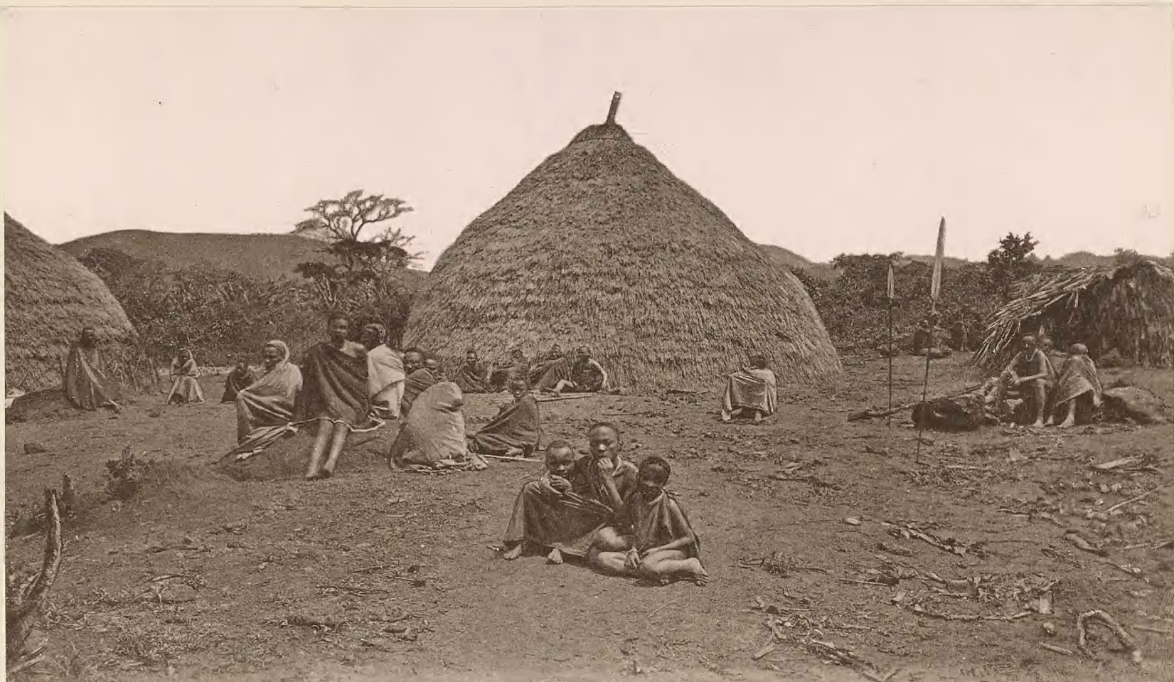
14. PLATZ VOR DER HÜTTE DES FÜRSTEN MAREALE IN MARANGU.