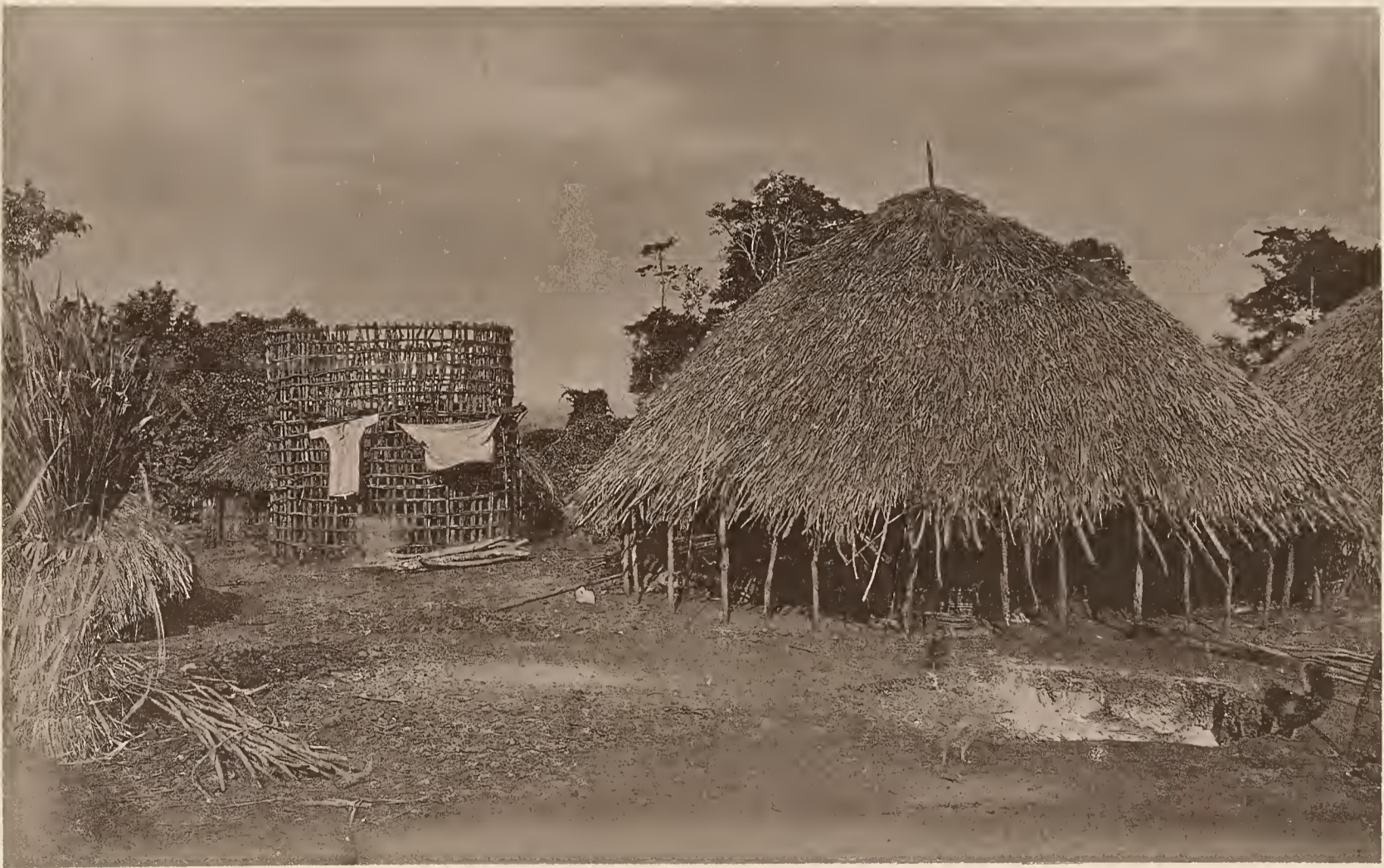
34. VOLLENDETE UND UNVOLLENDETE HÜTTE IM DORF LEWA AM RUFU.