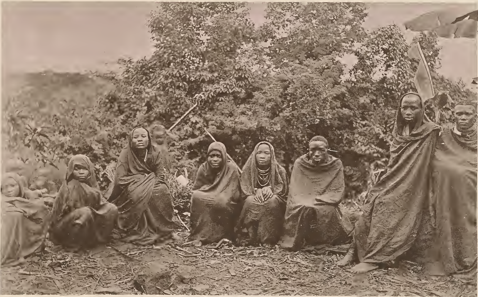
24. MAREALE MIT SEINEN FRAUEN.