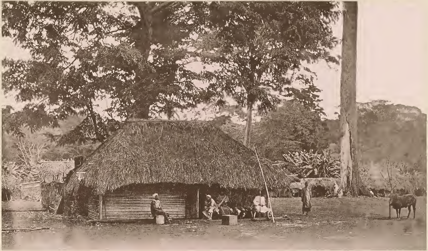
1. DAS ENGLISCHE LAGER IN TAWETA.