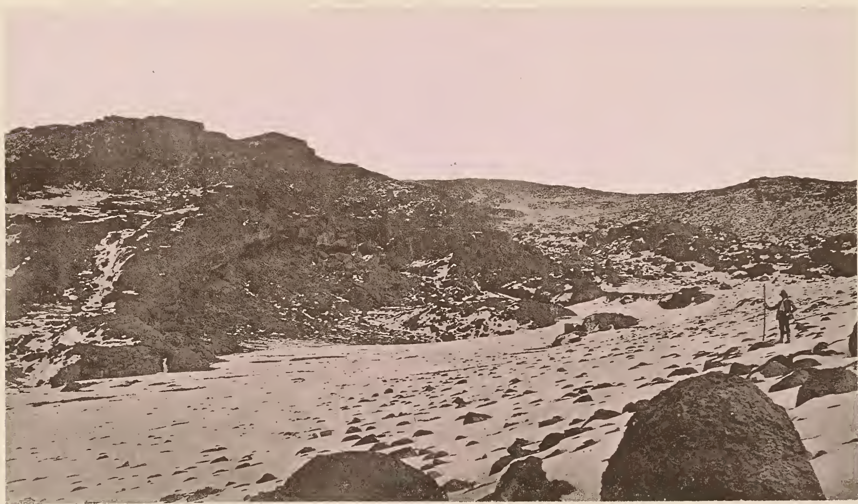
12. EIN SCHNEEFELD AN DER OSTSEITE DES KIBO.