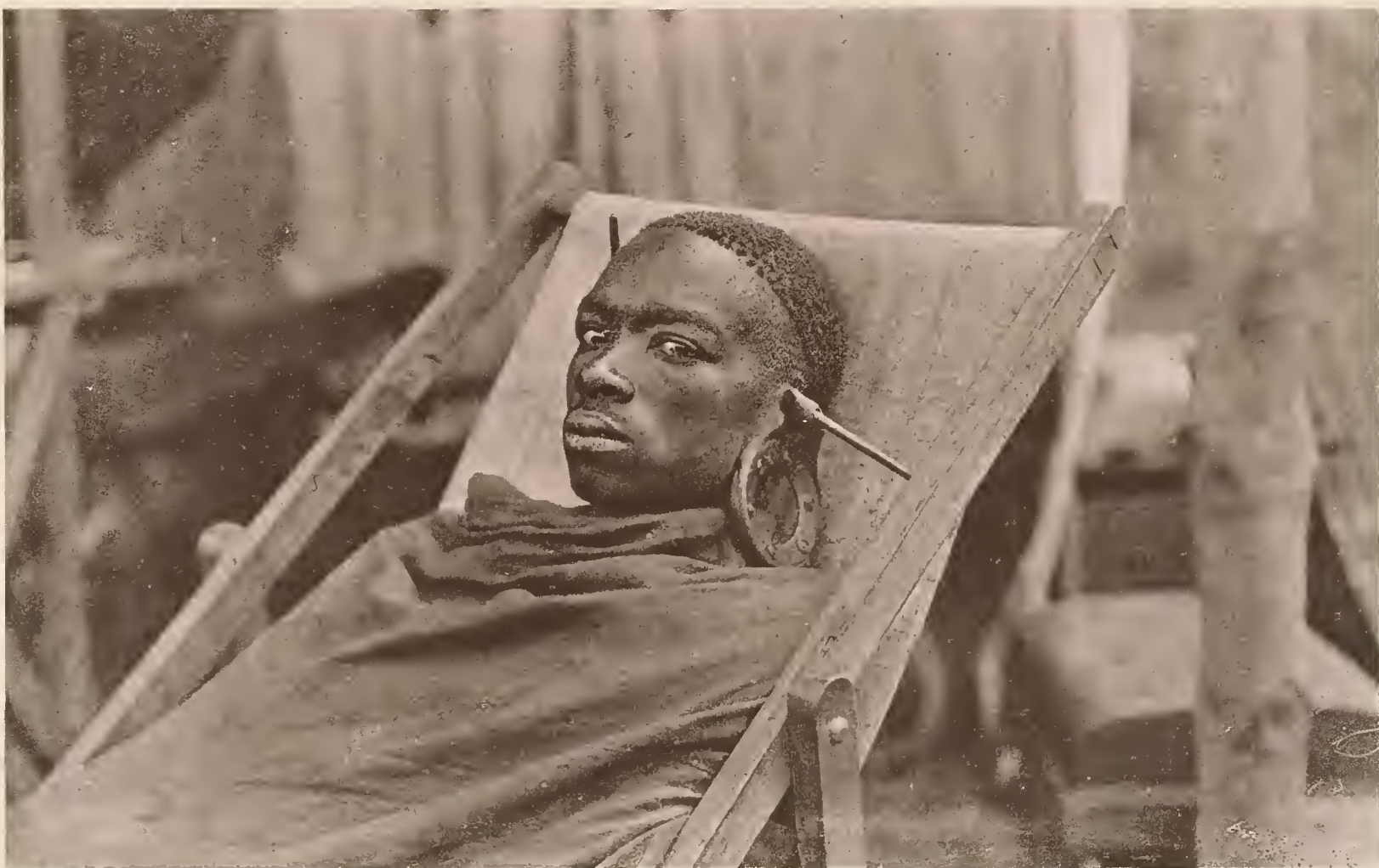
22. FÜRST MAREALE VON MARANGU.