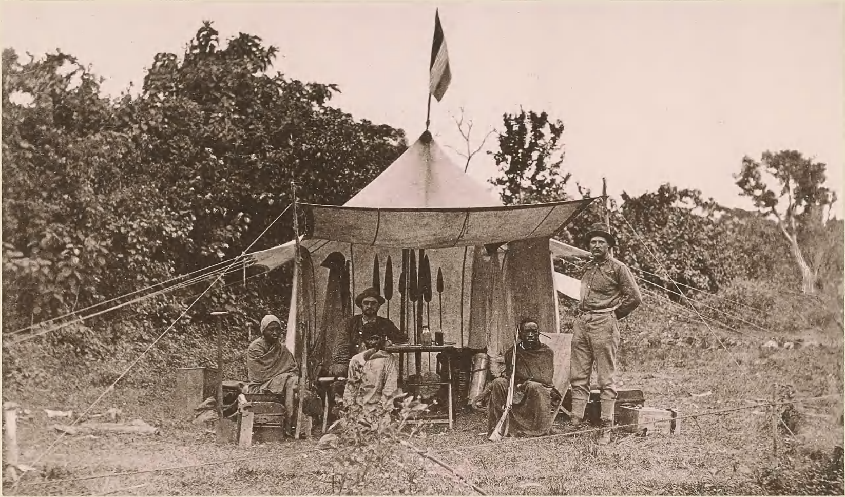
13. LAGER IN DER DSCHAGGALANDSCHAFT MARANGU.