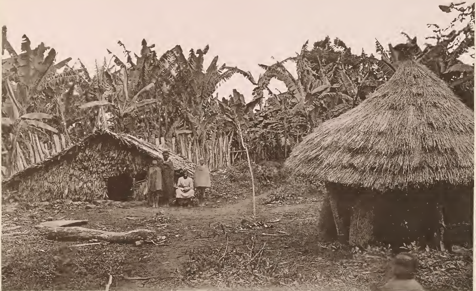
16. VORRATSHÜTTEN IN MARANGU.