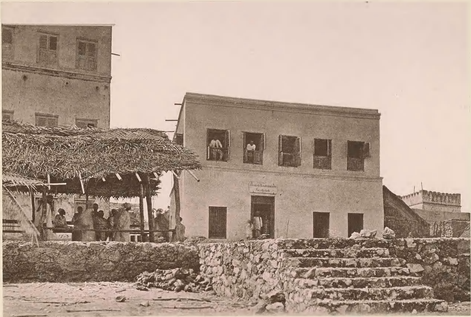
35. DAS HAUS DER D.-O.-A. GESELLSCHAFT IN PANGANI.