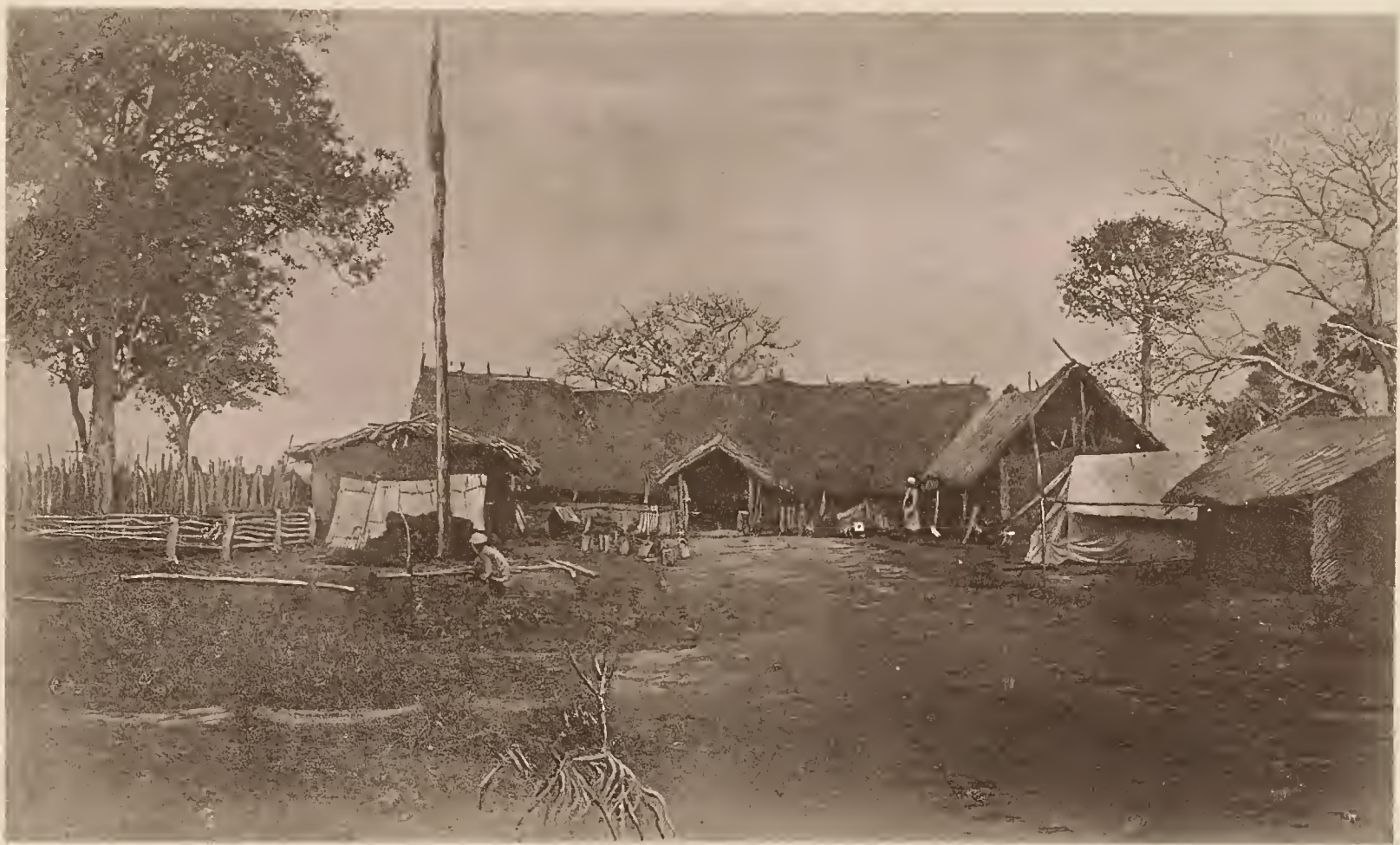
39. DIE KINGANI-STATION USUNGULA DER D.-O.-A. GESELLSCHAFT.