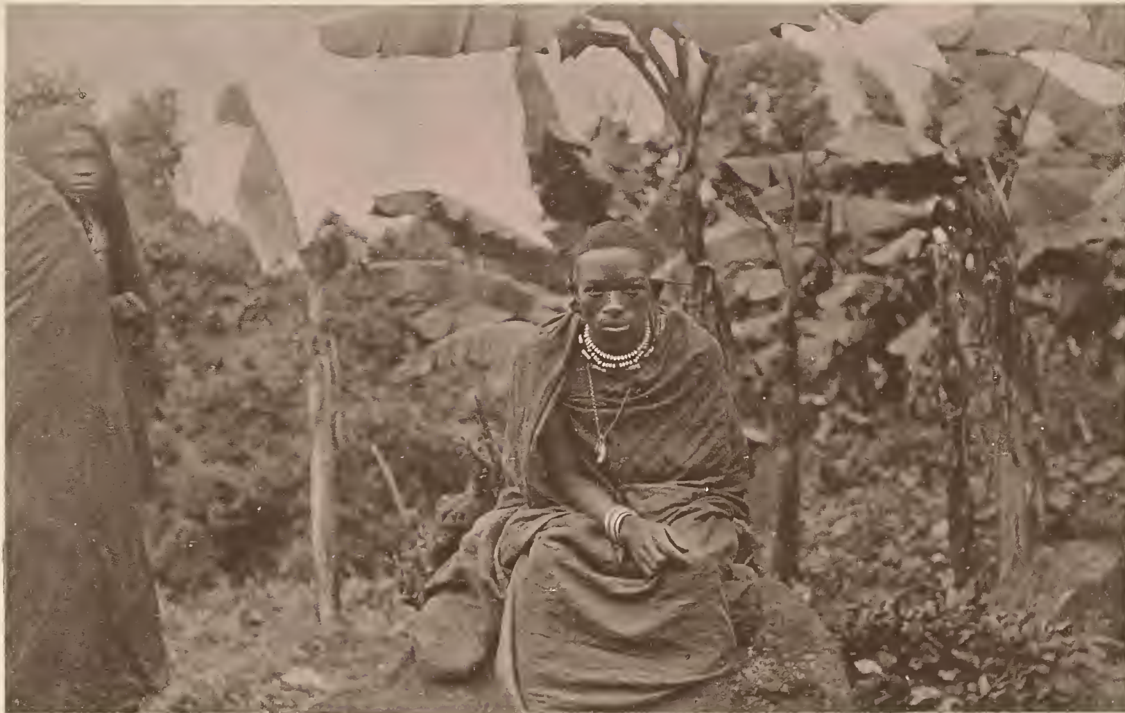
21. FÜRST MAREALE VON MARANGU.