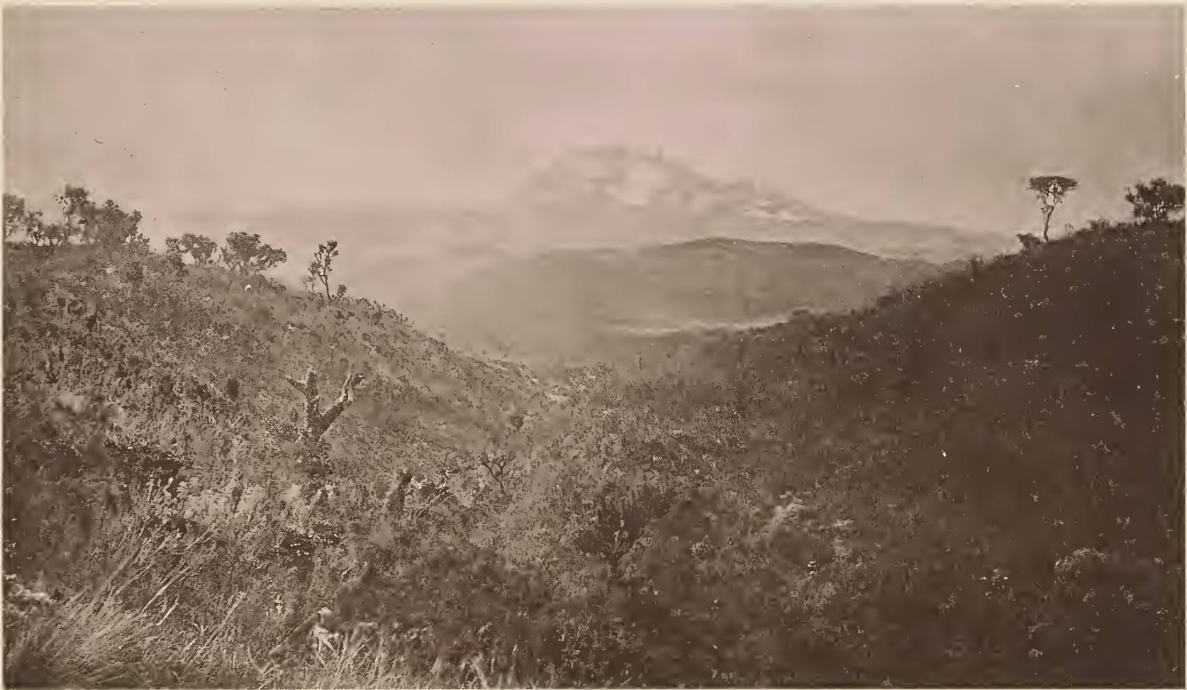
7. DER KIMAWENSI; VOM „SENECIOBACH“ OBERHALB DER WALDGRENZE AUS SW. GESEHEN.