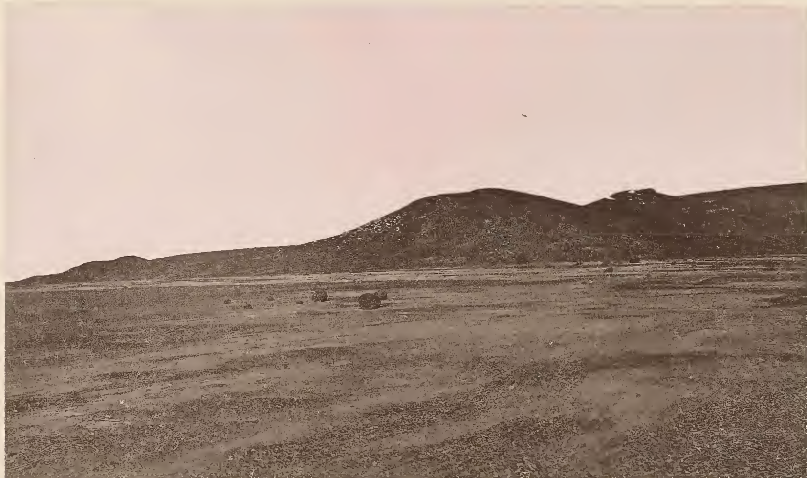
Anschluss an obenstehendes Bild.