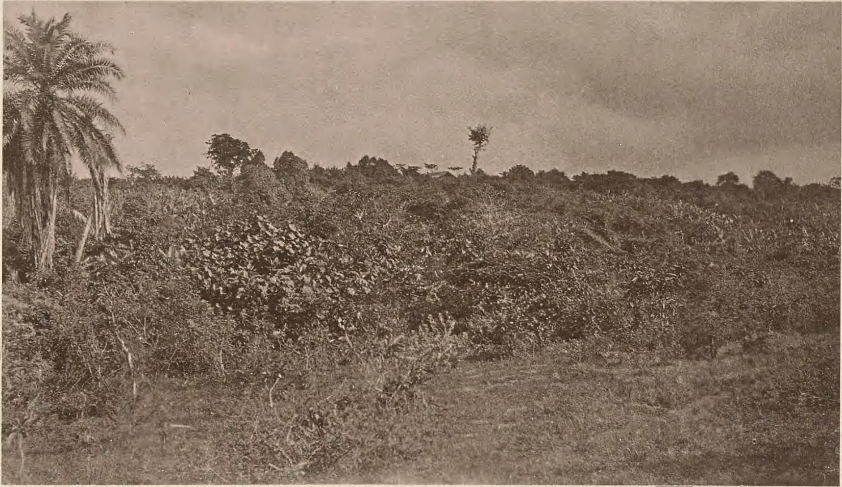
3. DIE DSCHAGGA-LANDSCHAFT MARANGU AM SÜDABFALL DES KILIMANDSCHARO.