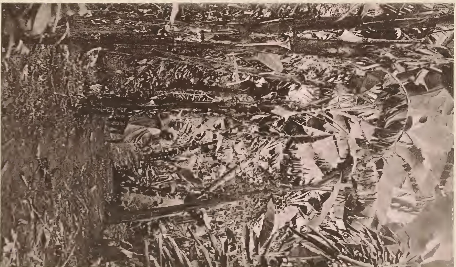
20. FINE BANANENPFLANZUNG IN MARANGU.