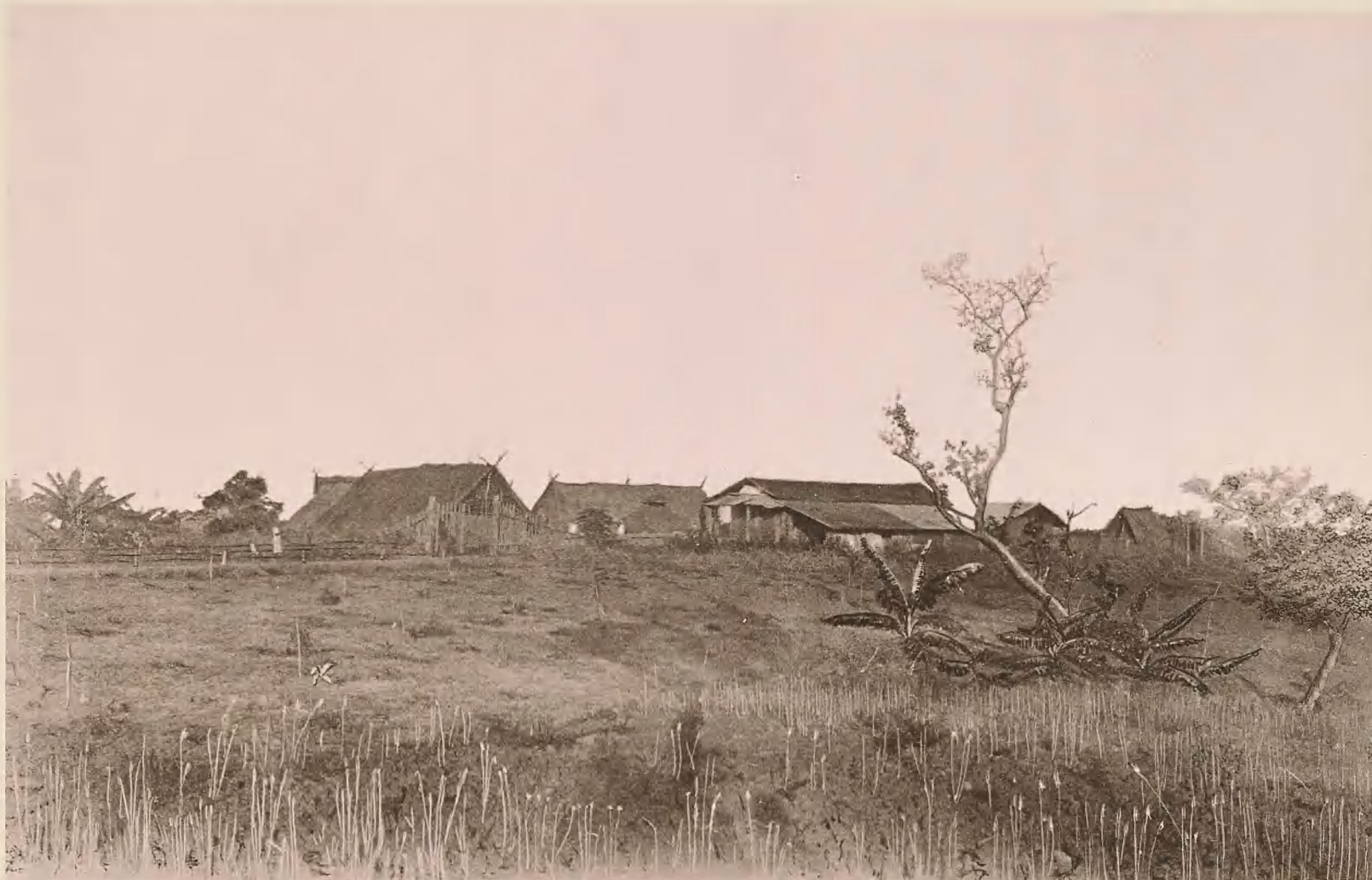
37. DIE STATION DUNDA DER D.-O.-A. GESELLSCHAFT.