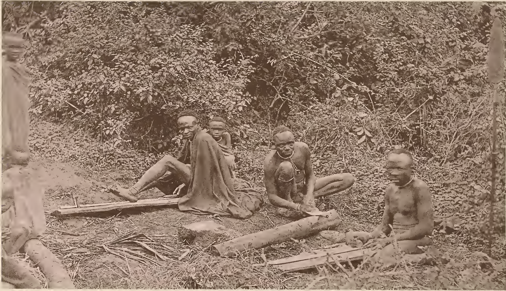
25. SCHWERTFEGER DES FÜRSTEN MAREALE VON MARANGU.