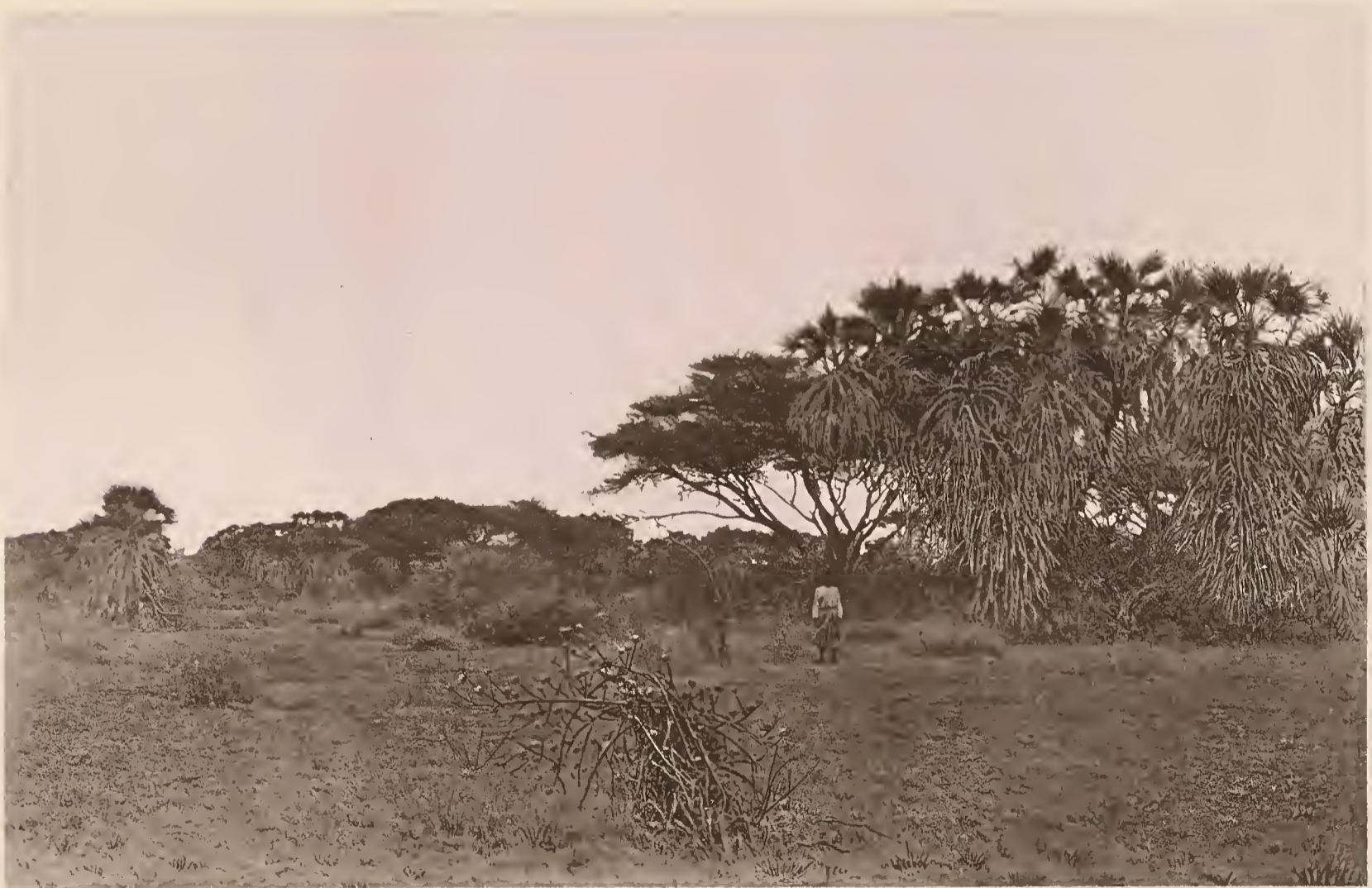
28. VEGETATION AM OSTUFER DES DSCHIBE-SEES.