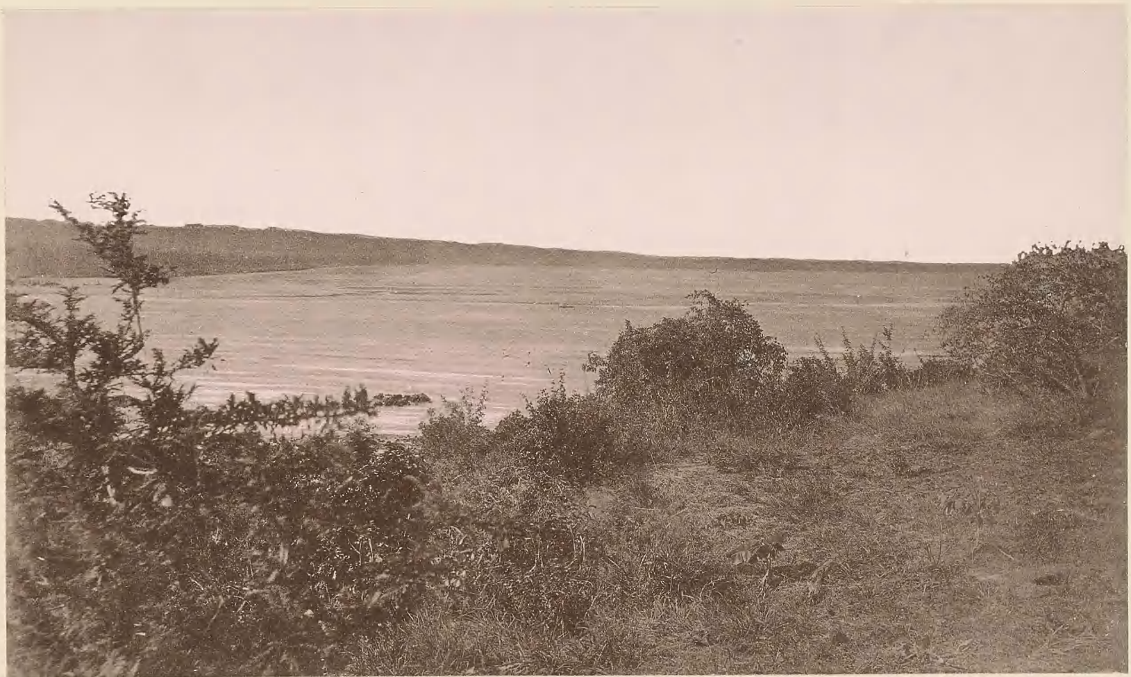
36. DIE MÜNDUNG DES RUFU BEI PANGANI.