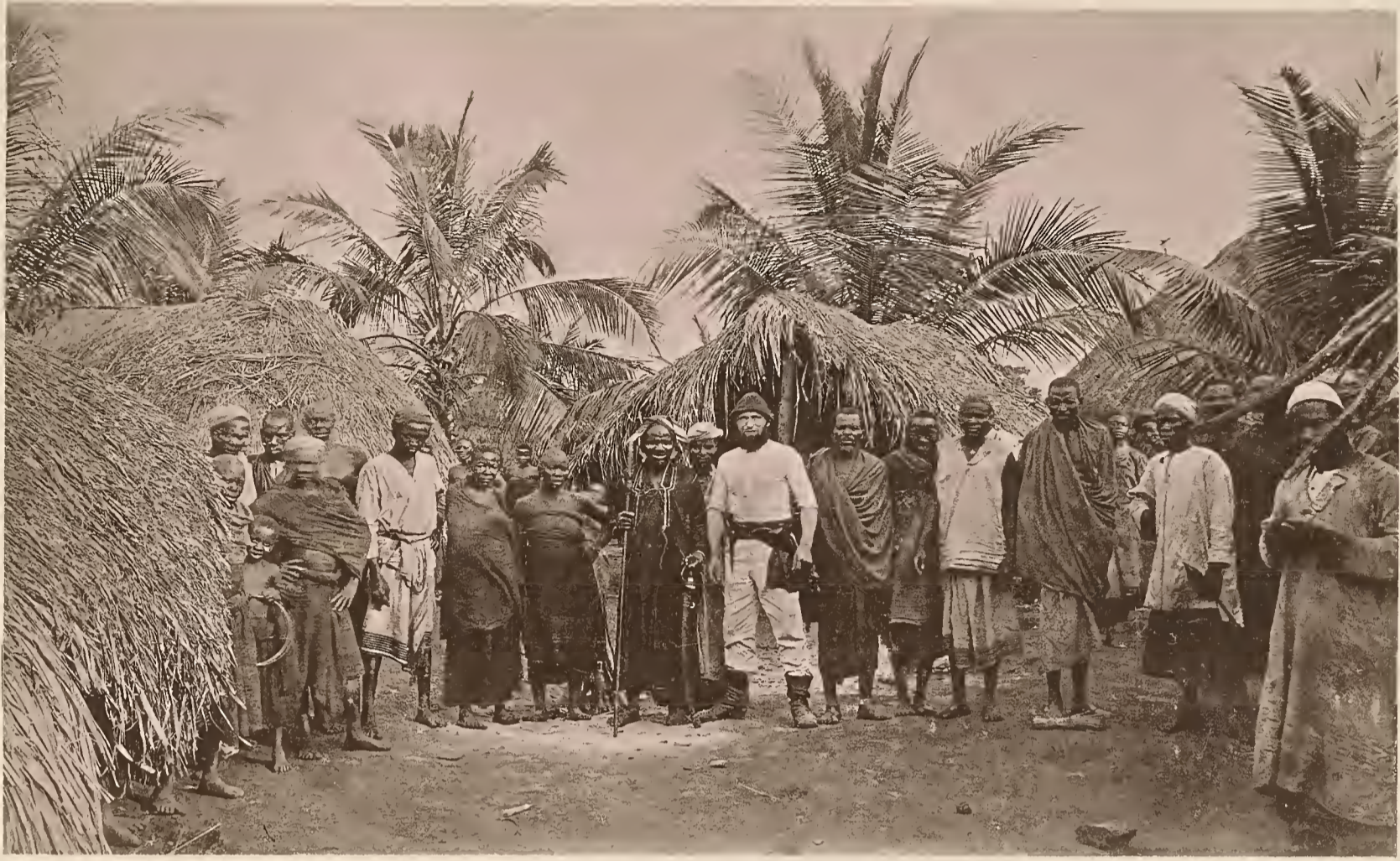
33. PLATZ IM DORF LEWA AM RUFU.