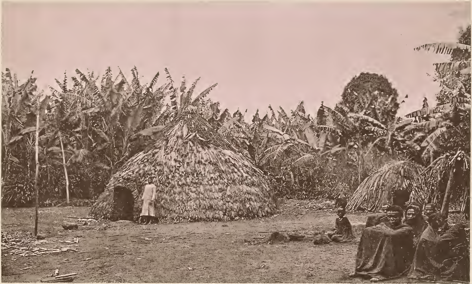
15. HÜTTEN DER MUTTER DES FÜRSTEN MAREALE IN MARANGU.