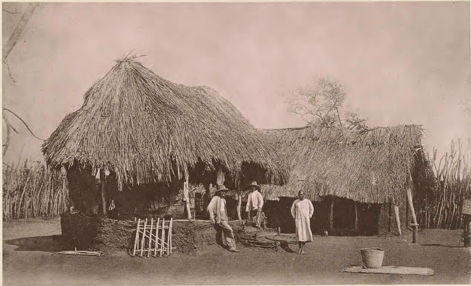
30. DIE STATION MAFI DER D.-O.-A. GESELLSCHAFT.