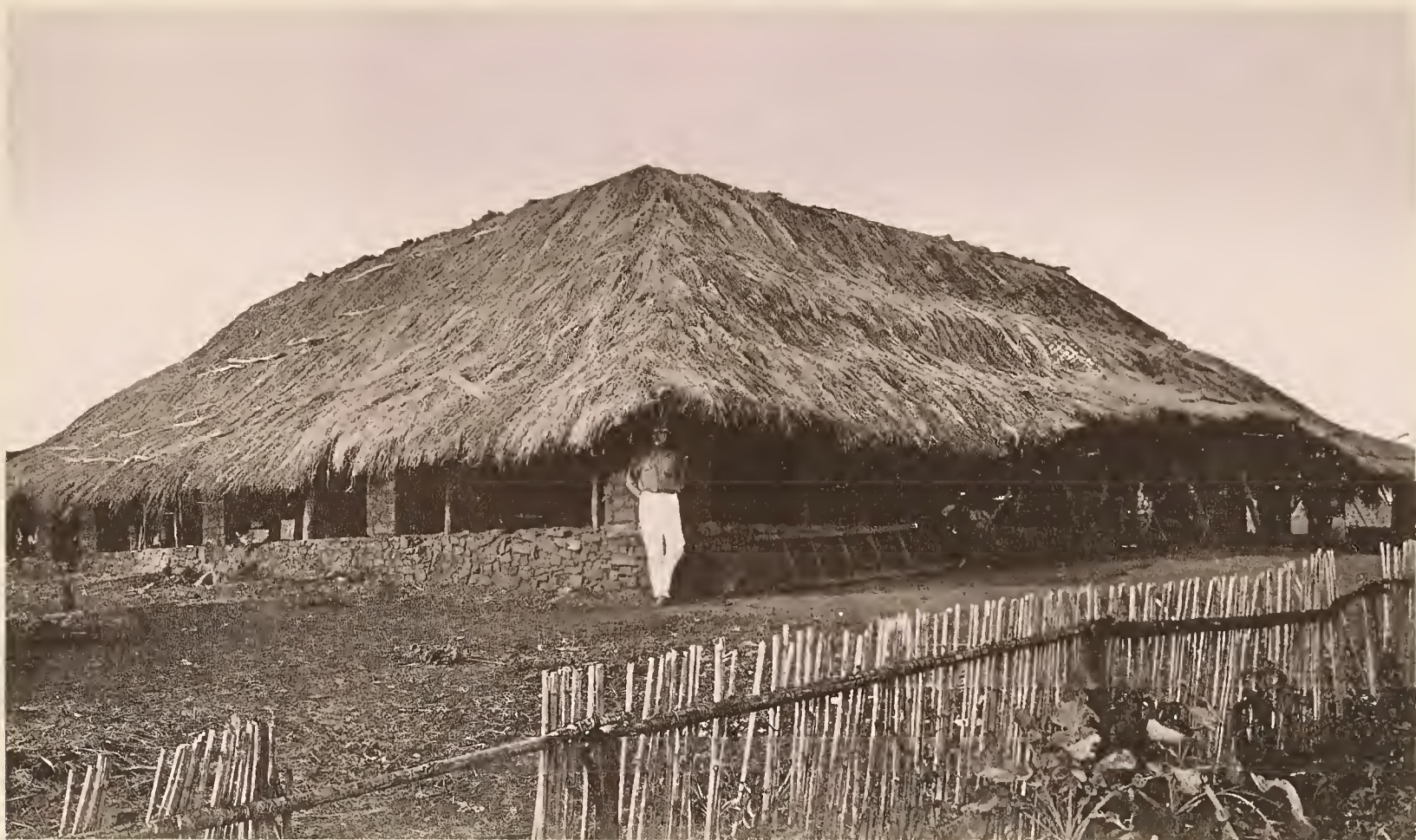
32. DIE STATION KOROGWE DER D.-O.-A. GESELLSCHAFT, SEITENANSICHT DES HAUPTGEBÄUDES.