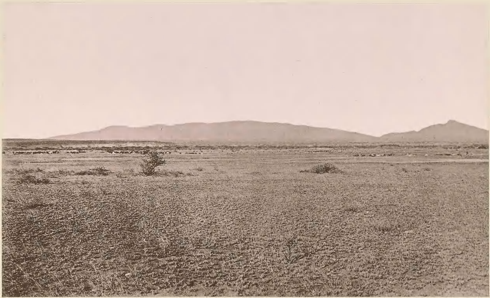
29. DIE STEPPE ZWISCHEN RUFU-FLUSS UND PAREGEBIRGE; IM MITTELGRUND MASSAI-HERDEN.