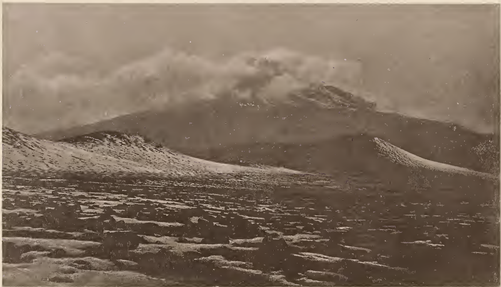
11. DER KIMAWENSI IN WOLKEN; VOM FUSS DES KIBO (4400 m) AUS W. GESEHEN.