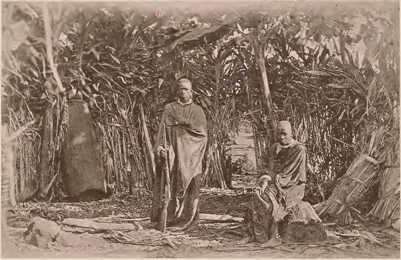
23. MAREALE MIT HAUPTFRAU.